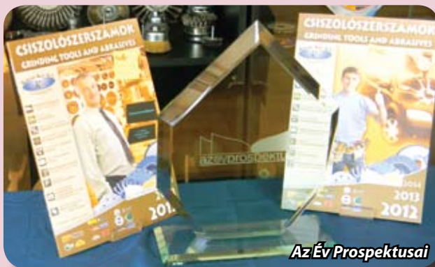
Az Év Prospektusai