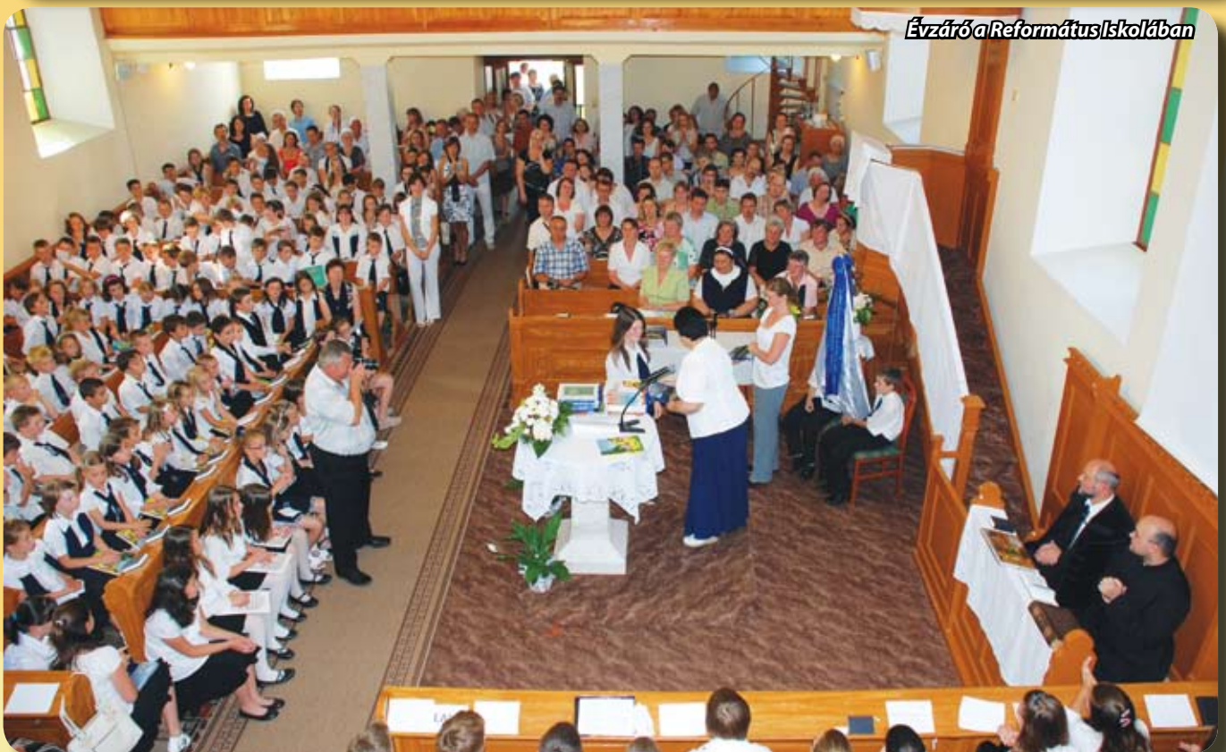
Évzáró a Református Iskolában