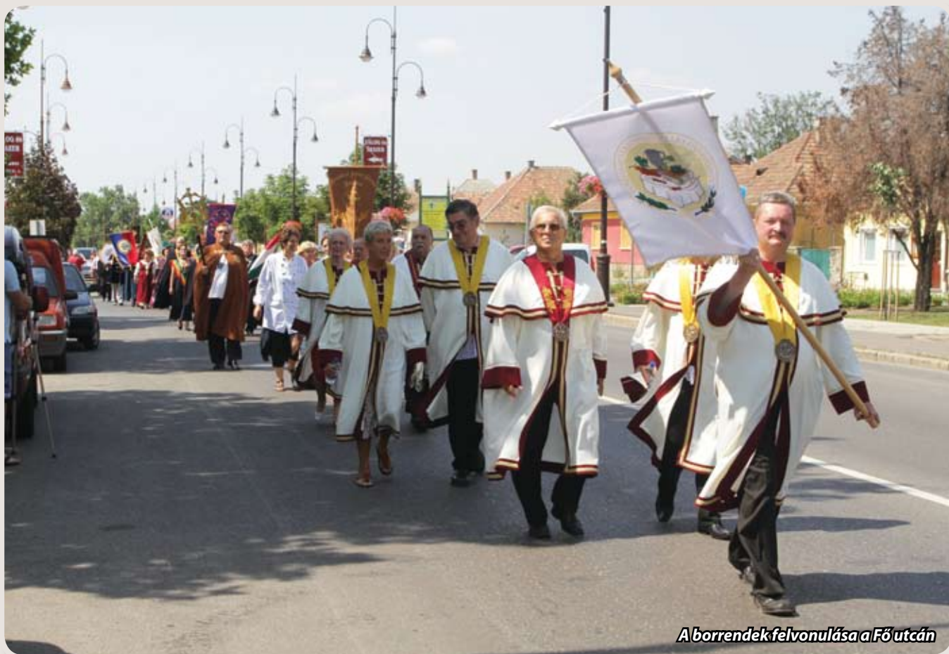
A borrendek felvonulása a Főútcán