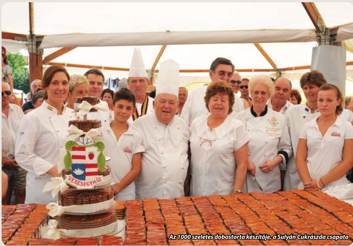
Az 1000 szeletes dobostorta készítője, a Sulyán Cukrászda csapata