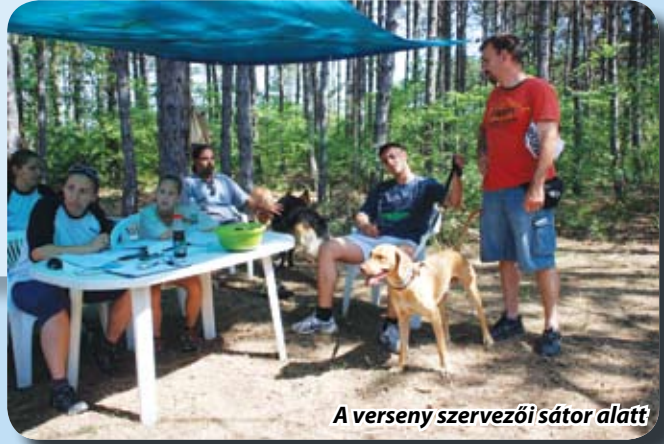
A verseny szervezői sátor alatt

Illett az elnevezés erre a sportnapra, mert a Veresegyházi Kutyaiskola rendezvénye csodálatos zöld környezetben, a fák közt beszűrődő villódzóan éles napsütésben a smaragd értékét és színét is az eszünkbe juttatta.