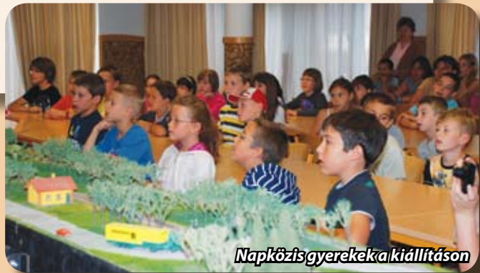
Napközisgyerekek a kiállításon

A rendezvényt Pásztor Béla polgármester nyitotta meg, közel 60 gyermek jelenlétében, akik nagyszerűen szórakozva még egy csatakiállást is megtanultak az alkalomra.