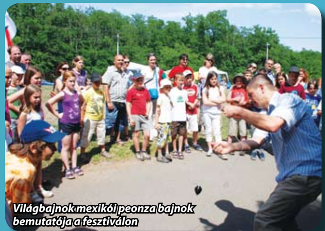
Világbajnok mexikói peonza bajnok bemutatója a fesztiválon