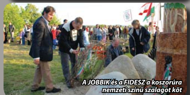
A JOBBIK és a FIDESZ a koszorúra nemzeti színű szalagot köt