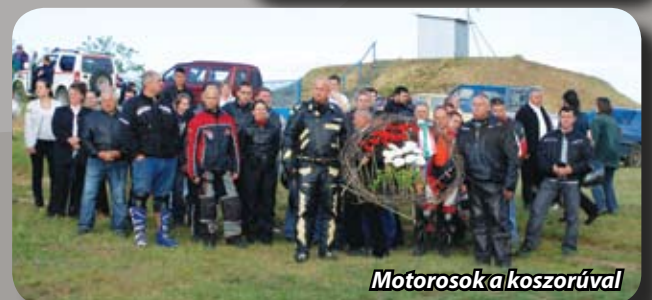
Motorosok a koszorúval