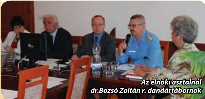
Az elnöki asztalnál dr.Bozsó Zoltán r. dandártábornok

Tábornok úr beszámolójából biztató adatokat derültek ki a közbiztonságunkról, a különböző bűncselekmények száma minden ágazatban csökkenést mutat az egy évvel korábbi adatokhoz képest. Szerepet játszott ebben a tavalyi évben, Gödöllőn tevékenykedett EU elnökség, amely kihívást jelentett a Kapitányságnak, mivel ők feleltek a magas rangú személyzet és látogatóik biztonságáért. Ehhez a feladathoz igen jelentős létszámbővítést kapott a kapitányság. A fél éven át tartó kiemelt biztosítási feladatot közmegegyezésre végezték, említésre méltó zavar nem történt, s még a környék lakosságának sem okoztak aránytalan nehézséget a közlekedésben, így valóban mindenki elégedett volt.