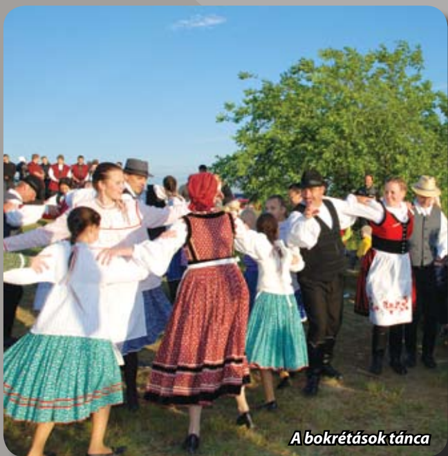
A bokrétások tánca