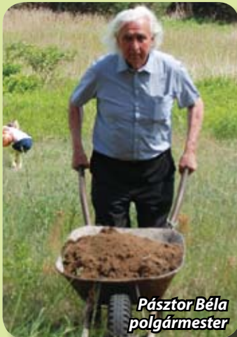
Pásztor Béla polgármester

Itt lakom a közelben, van egy 6 éves lányom, aki nagyon szeret játszani. Gyerekkoromban én is ezen a játszótéren nőttem föl. Az azonban még nem volt EU szabvány, meg persze már nagyon elhasználódott az idő folyamán. Jöttünk segíteni, szinte mindenkit ismerek, akik itt dolgoznak, nevezhetjük ezt akár egy baráti társaságnak is. Természetes, hogy majd vigyázunk is erre a játszótérre. Mi társadalmi munkában tesszük, amit kell, de valószínűleg az önkormányzatnak ez pénzebe is került, köszön-jük.