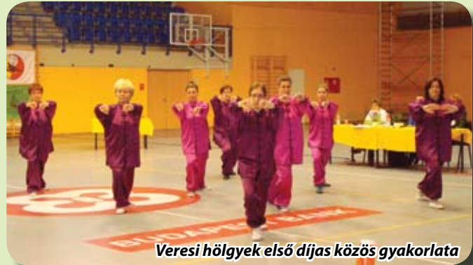
Veresi hölgyek első díjas közös gyakorlata

Ezzel az említett kis kitartó csoporttal elhatároztuk, hogy részt veszünk az V. Tavaszi Kikelet Kupán, ami kimondottan kezdőknek állít bemutatkozási lehetőséget. Reggel a csapat még egy kicsit szorongott, de később – elmondásuk szerint - remek hangulatban