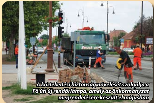
A közlekedési biztonság növelését szolgálja a Fő úti újrendőrlámpa, amely az önkormányzat megrendelésére készült el májusban