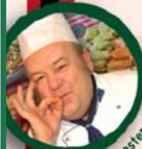
Ceremoniamester: Benke László olympiai bajnok mesterszakács