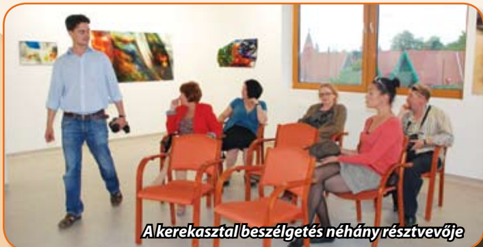
A kerekasztal beszélgetés néhány résztvevője

Az ENIGMA ART Galéria legutóbbi kiállításáról, a különleges üvegfestményekről, már adtunk hírt előző lapszámunkban. A szokásos kiállítási megnyitót követően - immár nem az első alkalommal - szakértő bevonásával tárlatvezetésen is részt vehettünk. Ez az újszerű megközelítés azért is érdekes, mert már nemcsak magunkban hümmögve sétálunk képtől képig a galériában.