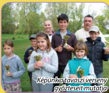
Képünk a tavaszi verseny győzteseit mutatja

NEVEZÉSI HELYEK: • Hari-Hari horgászbolt 2112 Veresegyház, Budapesti út 132. • Haldorádó horgásztó (Ivaci-tó) halórház