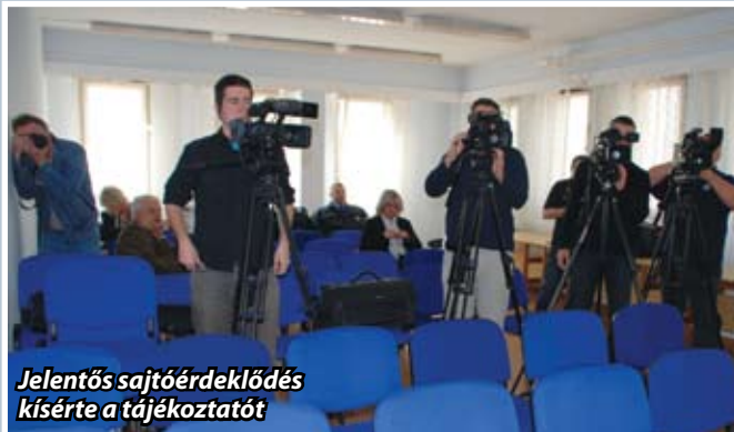
Jelentős sajtóérdeklődés kísérette a tájékoztatót