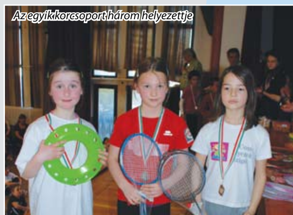
Az egyik korcsoport három helyezetteje