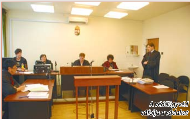
A védőügyvéd cáfolja a vádakot

Ismert, hogy a legutóbbi választások során melegítették fel a polgármesterünk ellen egyszer már hiába indított vádat, a ma már 17 évre visszanyúló telekeladás ügyében.