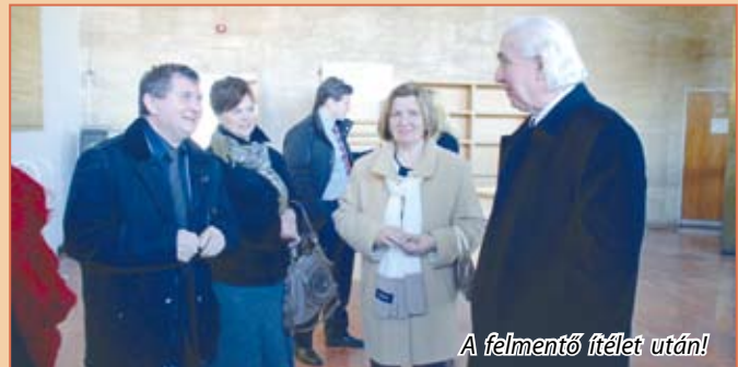
A felmentő ítélet után!

Nem tudom, hogy kinek jó, miért jó ez a feljelentés. Ha azok az emberek nem érzik jól magukat Veresegyházon, ha nem tetszik, nem szimpatikus nekik az önkormányzat vagy annak a vezetője, akkor van egy tanácsom: költözzenek el máshová!