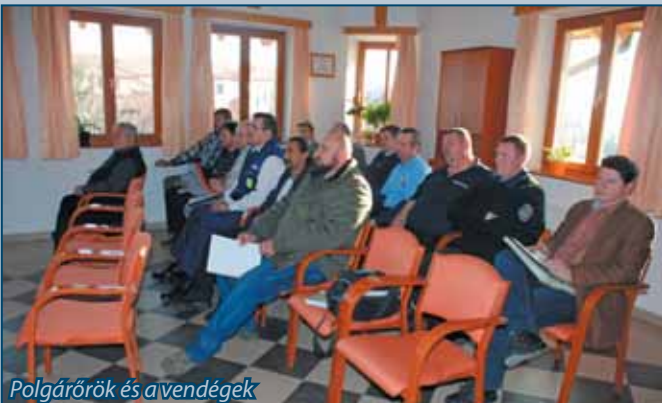
Polgárőrök és a vendégek

Hallhattunk a három nappal korábban megalakult KEF-ről, melynek kapcsán elhangzott, hogy az űrs látókörében található területen, mind a hat településen (Szada, Veresegyház, Erdőkertes, Váckisújfalu, Vácegres és Galgamácsa) jelen van a kábítószer, s a legszomorúbb, hogy már nem csak iskola, hanem óvoda környékén is előfordulnak ez után érdeklődő fiatalok és alkalmanként terjesztők. Felhívta a figyelmet, milyen nagy segítség ilyen esetben a lakossági bejelentés, akár egy gyanús gépkocsi rendszáma is. Szerencsére