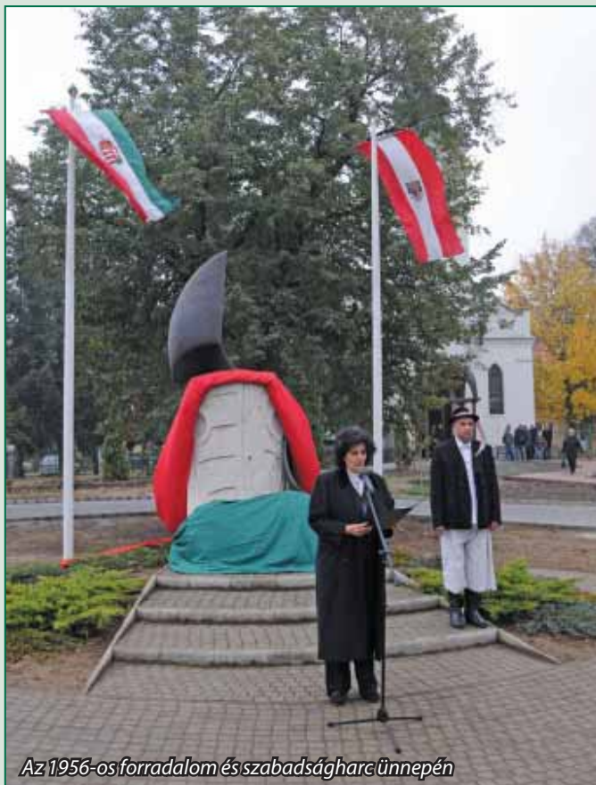
Az 1956-os forradalom és szabadságharc ünnepén