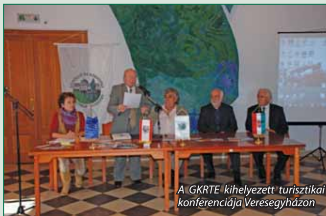
A GKRTÉ kihelyezett turisztikai konferenciája Veresegyházon