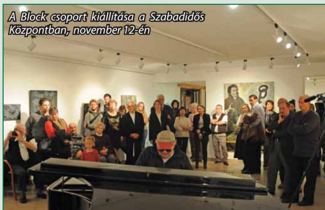
A Block csoport kiállítása a Szabadidős Központban, november 12-én