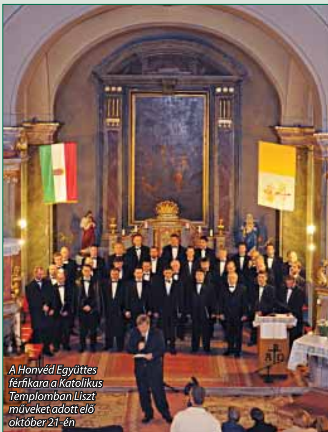
A Honvéd Együttes férfikara a Katolikus Templomban Liszt műveket adott elő október 21-én