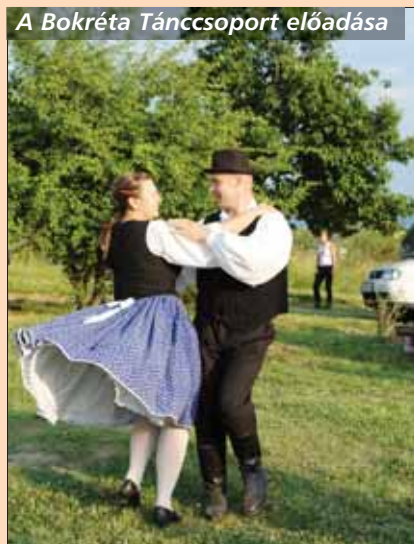
A Bokréta Táncsoport előadása