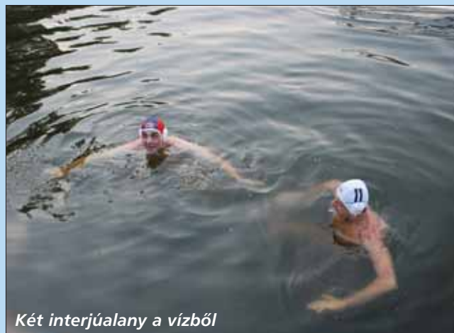
Két interjúalany a vízből