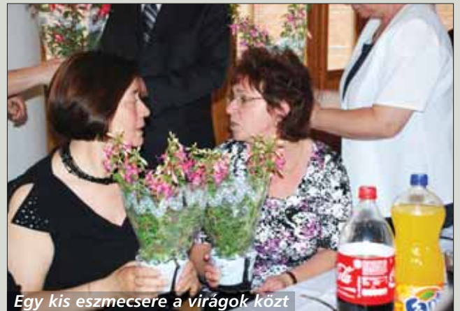
Egy kis eszmecsere a virágok közt