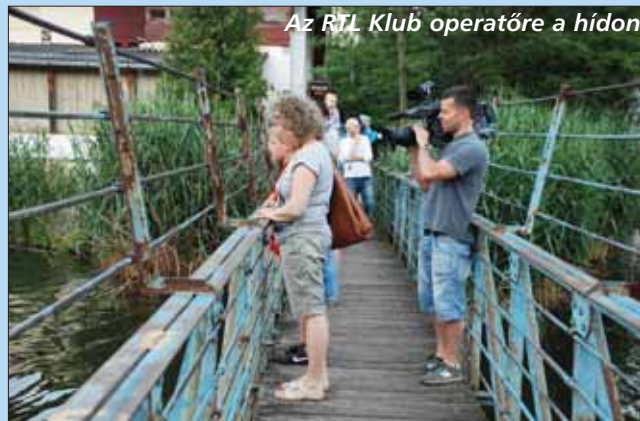
Az RTL Klub operátora a hídon

Június 7-én egy tó-vízilabda edzőmérkőzésre az RTL Klub is kiküldte egyik forgatócsoportját Veresre, akik a lelkesen filmmezték a játékot. A meccs végén interjút is készítettek, stílszerűen a vízben tempózó két riportalannyal, míg ők fönt a hídról tették fel kérdéseiket.