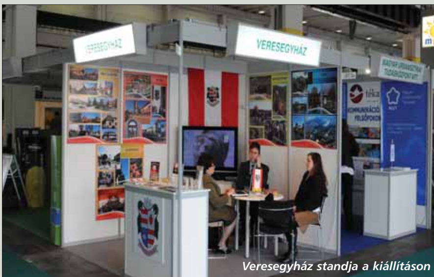
Veresegyház standja a kiállításon