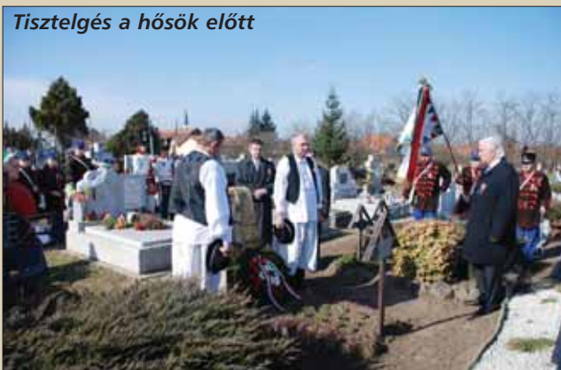
Tisztelgés a hősök előtt