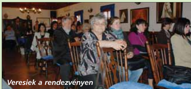
Veresiek a rendezvényen

A Gödöllő Környéki Regionális Turisztikai Egyesület szokásához híven az éves közgyűlését Domonyvölgyben, a Lázár Lovasparkban tartotta április 13-án.