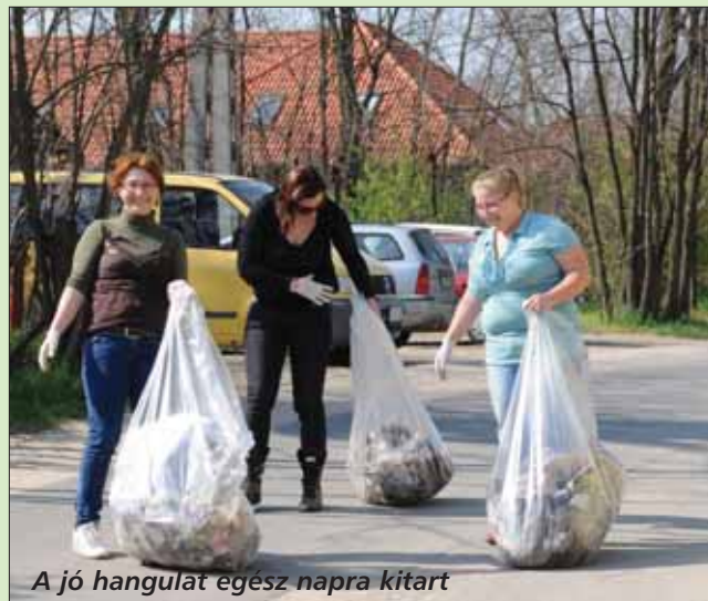
A jó hangulat egész napra kitart