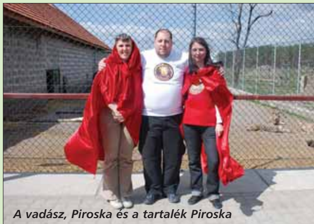
A vadász, Piroska és a tartalék Piroska