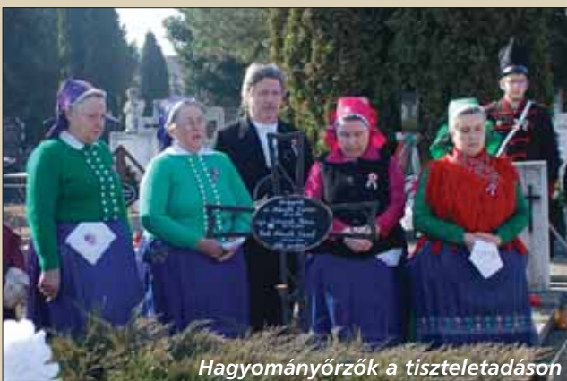
Hagyományőrzők a tiszteletadáson