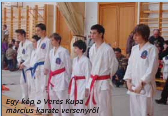
Egy kép a Veres Kupa március karate versenyről