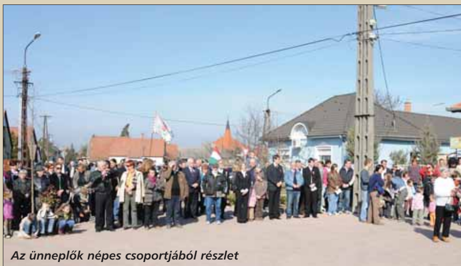
Az ünneplők népes csoportjából részlet