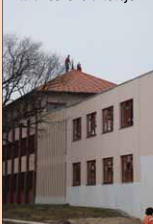
Munkálatok a Fabriczius Általános Iskola tetején

A munka láthatóan halad, bár egy akadály már jelentke- zett, egy tűzérési lövedék képében. Még a földmunkák során került elő, s természet- esen azonnal bombairadót rendeltek el. Megsemmisíté- sére a Honvédelmi Minisz- térium küldött robbanó- anyag szakértőt. A 37 mm-es magyar gyártmányú páncél- törő lövedéket, melynek a vizsgálat szerint 1942-es min- tájú gyújtószerkezete volt, felrobbantásra az erdőkeresi megsemmisítő telepre szállí- tották.