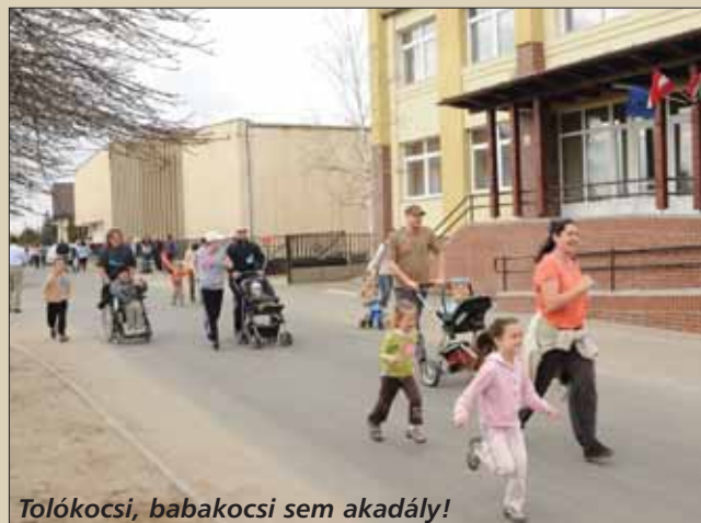
Tolókocsi, babakocsi sem akadály!