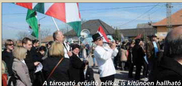
A tárogató erősítő nélkül is kitűnően hallható