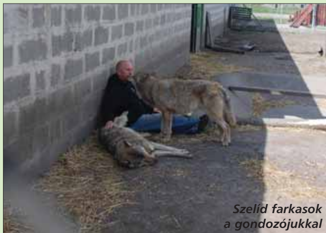
Szelíd farkasok a gondozójukkal