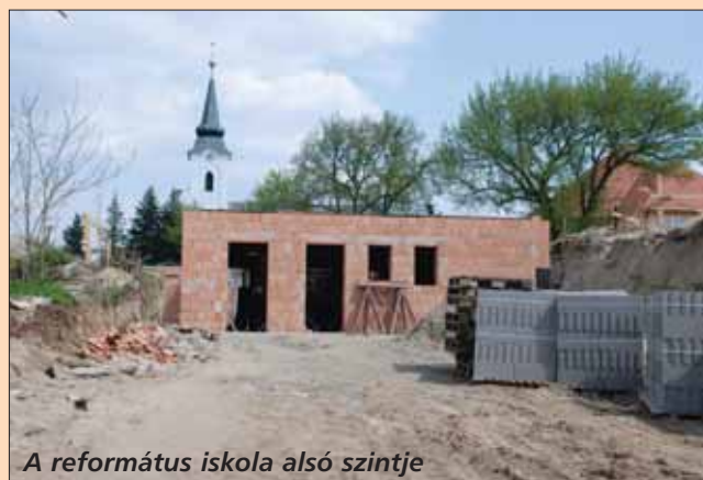
A református iskola alsó szintje

Nem vandál rongálás, se nem kegyeletsértés, hanem vízmosás okozta a temetőben a sírok megrom- lását. A kár az összes károsodott sírral számolva, becslések szerint eléri a 10 millió Ft-ot.