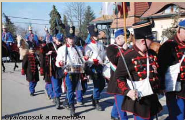
Gyalogosok a menetben