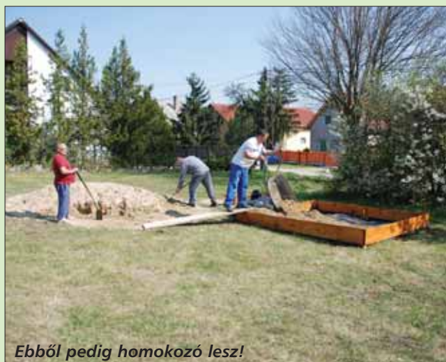
Ebből pedig homokozó lesz!