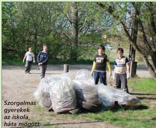
Szorgalmas gyerekek az iskola háta mögött