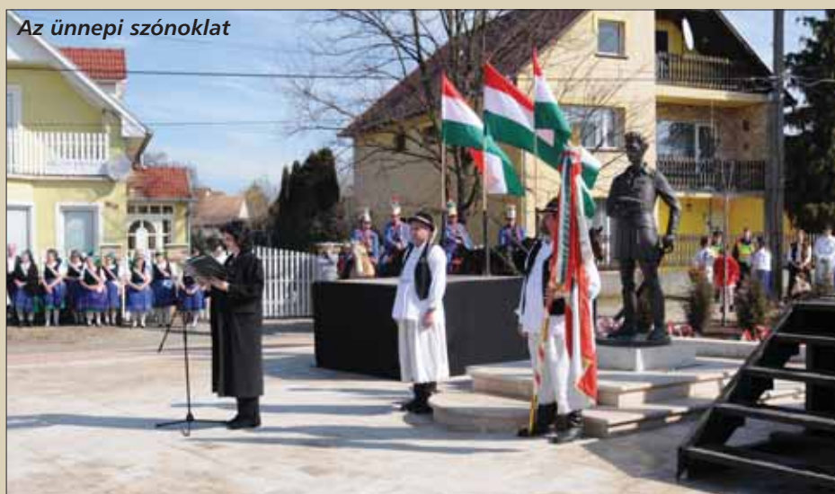
Az ünnepi szónoklat