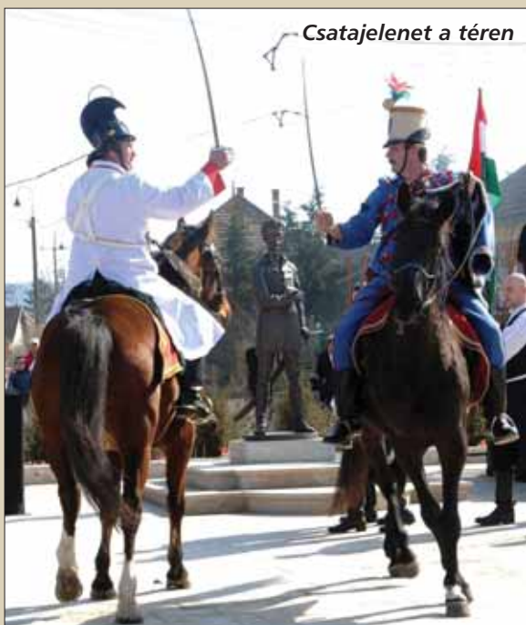
Csatajelenet a téren