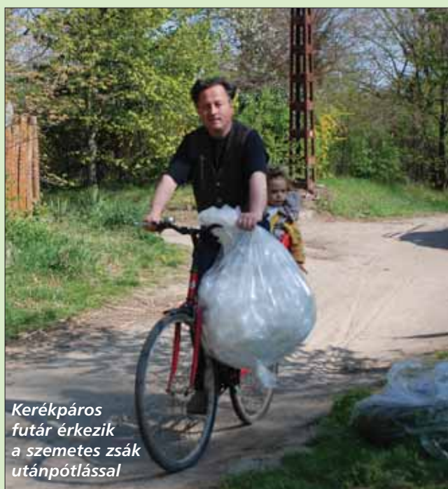
Kerékpáros futár érkezik a szemetes zsák utánpótlással