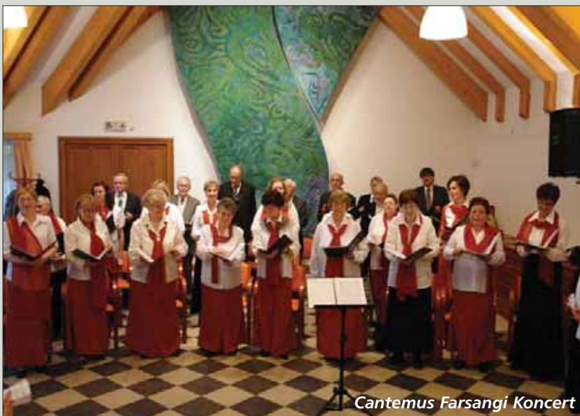
Cantemus Farsangi Koncert