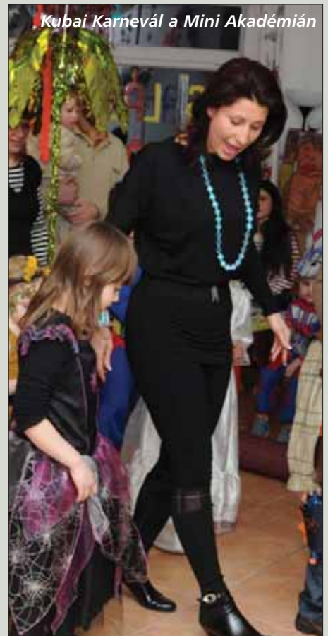
Kubai Karnevál a Mini Akadémián