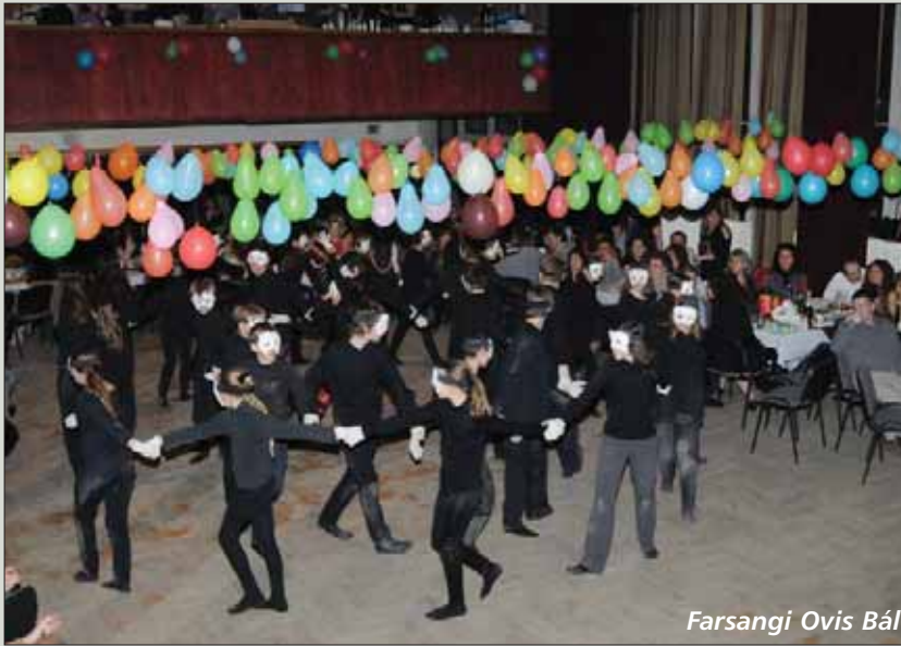
Farsangi Ovis Bál