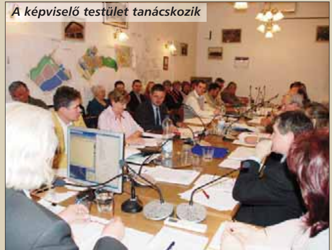
A képviselő testület tanácskozik