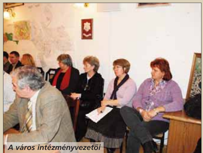
A város intézményvezetői