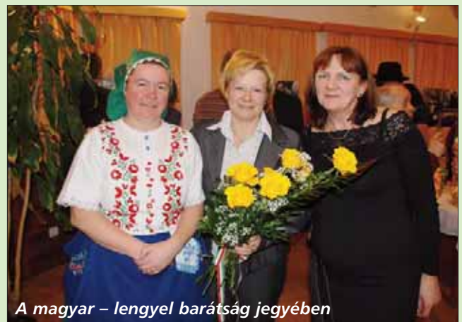
A magyar – lengyel barátság jegyében

Tel./fax: 06-28-769-166; 06-28-413-014 Mobil: 06-70-605-3440