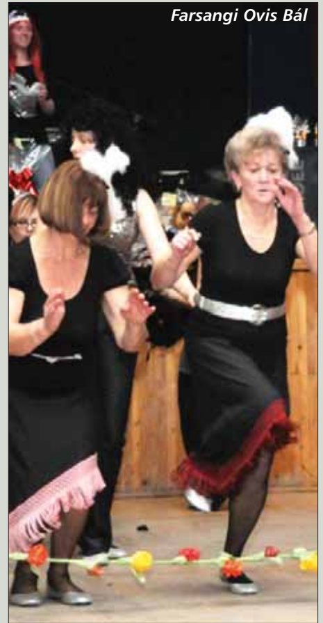
Farsangi Ovis Bál