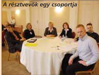
A résztvevők egy csoportja

sikeresen integráltak és jelenleg is foglalkoztatnak megváltozott munkaképességű munkavállalókat.