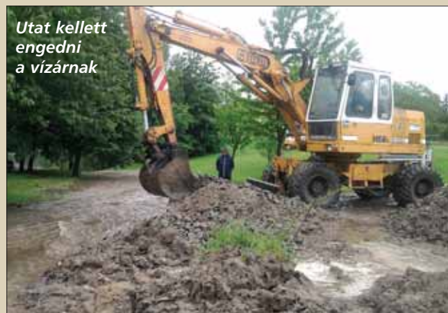
Utat kellett engedni a vízárnak

november 22-re befejeződtek. Az eredeti határidőt azonban nem lehetett tartani, s határidő módosítást kellett kérni a közreműködő szervezettől. Sikerült, az új határidő 2011. január 31. lett. Így maradt idő a jegyzőkönyvek, kimutatások, el-