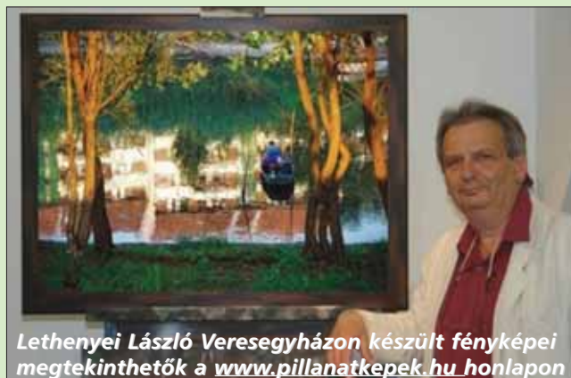
Lethenyei László Veresegyházon készült fényképei megtekinthetők a www.pillanatkpek.hu honlapon