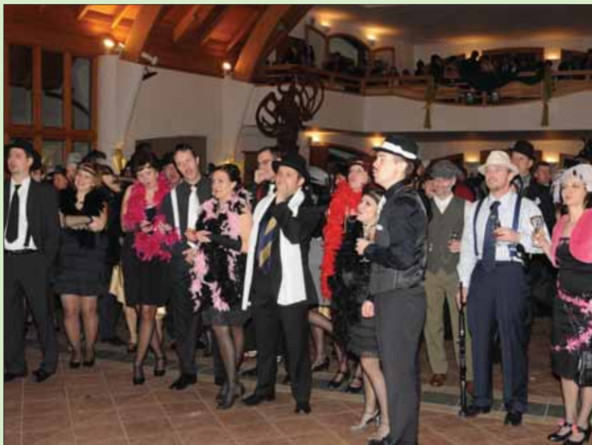
Komoly arcok a rulett asztal előtt

A bál tehát rendkívül jól sikerült, a környezet, a résztvevők és a hangulat pazar volt. Még sokáig fognak beszélni erről az éjszakáról akik ott voltak és sajnálkozni azok, akik ezt kihagyták, amint azt a blogok és más internetes visszaemlékezések bőséges mennyisége is jelzi.