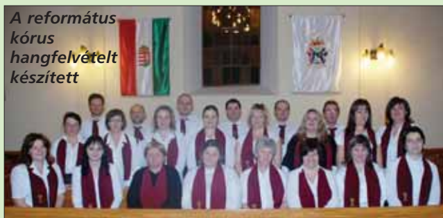
A református kórus hangfelvételt készített