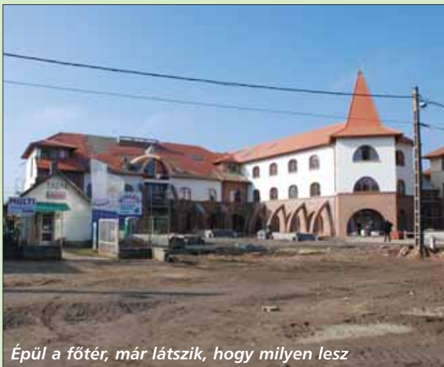
Épül a főté, már látszik, hogy milyen lesz