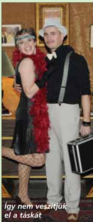
Így nem veszítjük el a táskát