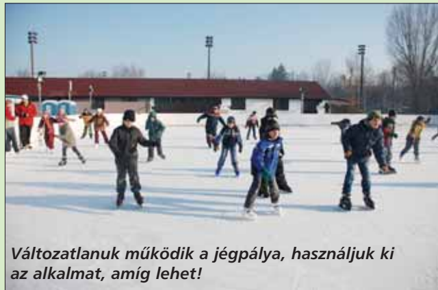
Változatlanul működik a jégpálya, használjuk ki az alkalmat, amíg lehet!