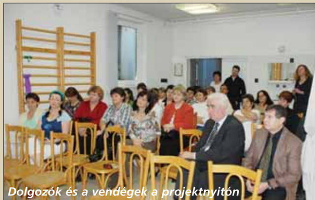
Dolgozók és a vendégek a projektnyitón

Az elvégzett felmérés szerint bizony szükség van ilyen megoldásokra, hiszen a dolgozók 50 %-a egyáltalán nem mozog, szabadideje vagy nincs vagy nagyon kevés van, s azt sem a sza-