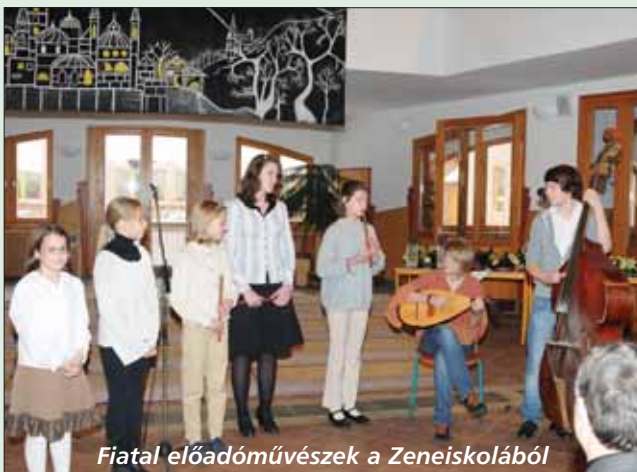
Fiatal előadóművészek a Zeneiskolából

35 km-nyi út épült a városban, bár ez nem mind aszfaltos, továbbá elkészült a tervezett kerékpárút és járda, amely a korábbi szakaszokat is összeköti a Fővétől Szadaig. A teljes vasútvonal korszerűsítés csak