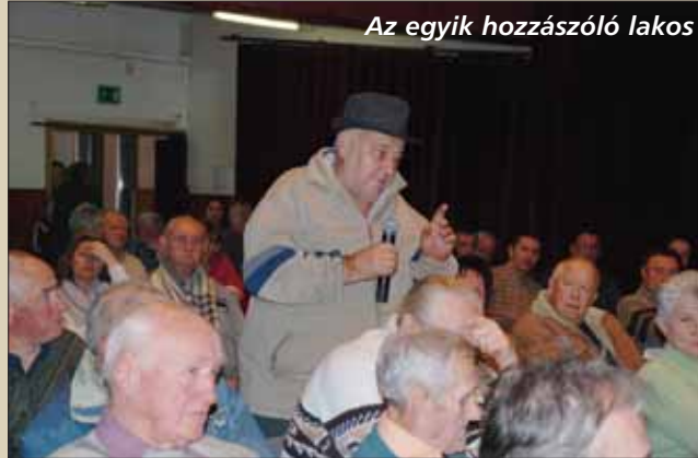
Az egyik hozzászóló lakos

cégek a válság ellenére üzemelnek, a befizetett iparüzési adó elérte a 3,2 milliárd forintot.