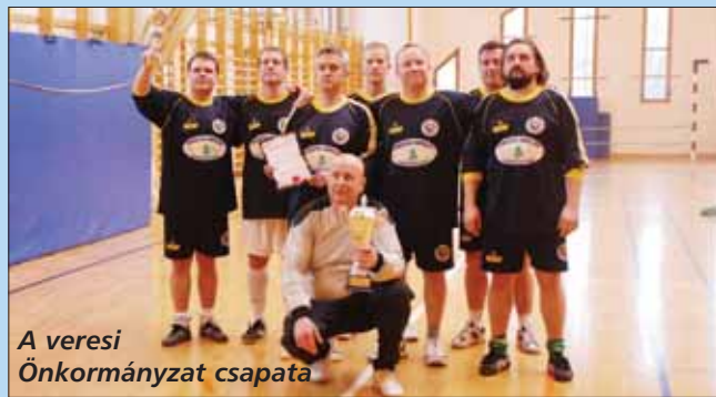
A veresi Önkormányzat csapata