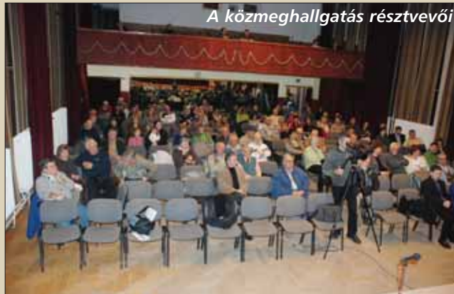
A közmeghallgatás résztvevői

Két újraélesztő (defibrillátor) géppel rendelkezik a város. Egyet az önkormányzat vásárolt, egyet a GE ajánlott fel. A GE-től származó gépet az iskolában helyezték el, a másiknak