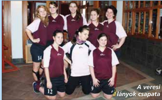
A veresi lányok csapata