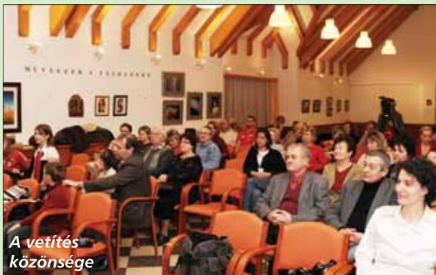
A vetítés közönsége

A VVTV ismertebb munkatársait képeinken mutatjuk be.