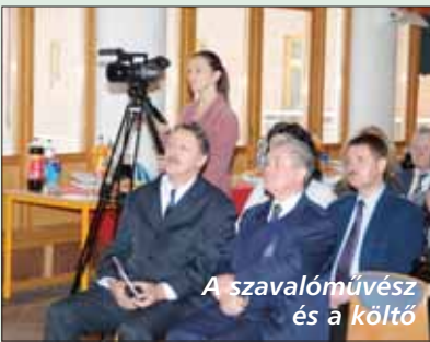
A szavalóművész és a költő

2013-ban történik, de az állománál már most épül a kamerákkal megfigyelt gépkocsi parkoló és a kerékpártároló.