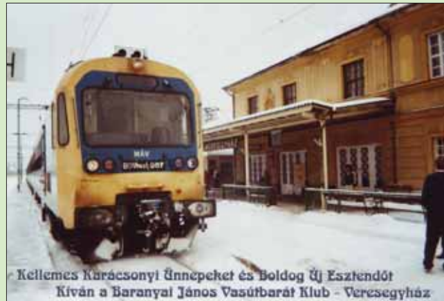
Kellemes Karácsonyi Ünnepeket és Boldog Új Esztendőt Kíván a Baranyai János Vasútbarát Klub - Versegyház

április 29. - május 1. Szécsény, a Szlovák-Magyar Vasutasnapok keretében /jelen pillanatban még bizonytalan/ július 1-3 - a Mézesvölgyi Ál-