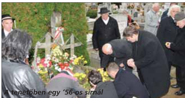
A tenetőben egy '56-os sírnál