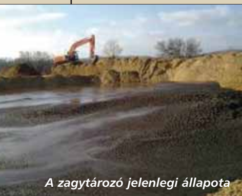
A zagyatározó jelenlegi állapota

kivitelezést, de sajnos a cég rossz gazdaságpolitikája valamint a gazdasági válság hatására nem tudta befe-