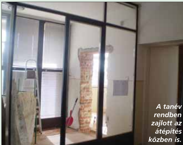
A tanév rendben zajlott az átépítés közben is.