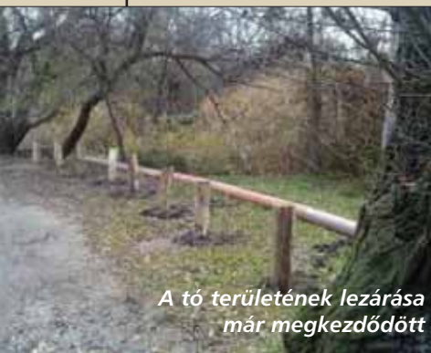
A tó területének lezárása már megkezdődött

Uniós pályázat keretében megkezdődött. Az első közbeszerzési eljárás győztes SZEVIÉP Zrt. kezdhette el a