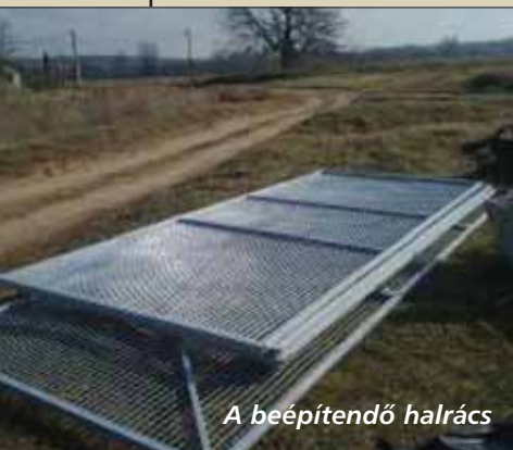
A beépítendő halrács

Az új közbeszerzési eljárás nyerteseként a fennmaradó munkák kivitelezését a DOVI-TRADE Kft. végezheti. A vállalkozás nem ismeretlen Veresegyházon, hiszen a zagyát megépítésénél a SZEVIÉP Zrt. alvállalkozójaként már jelen volt, és elismerést szerzett gyors, pontos és kifogástalan munkájával. Feladatuk most is gyors, pontos, tervszerinti munkavégzés, hogy a szűk határidőket tartani tudják, hiszen a munkát 2010 november 30-ig be kell fejezni, hogy az uniós előírásoknak a pályázat menete megfeleljen. A szűk határidők miatt a veresegyházi Önkormányzat elrendelte a kivitelező részére a 0-24 órás, hétvégén is tartó munkavégzést. Az ilyen ütemű munkavégzés nem csak a kivitelezőnek megerőltető, hanem a tó körüli lakosoknak is, hiszen a gépek zaja miatt nem biztosított a kellő pihenés. Remélhetőleg a munkák befejeztét követően a tó minőségének javulása, a kialakított szebb, élhetőbb és tisztább környezet felelteti majd a kellemtelenségeket.