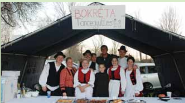
A Bokréta Tánccsoport is sátrat állított az ÉVÖGY által szervezett, jól sikerült jótékonysági napon, lásd képünkön