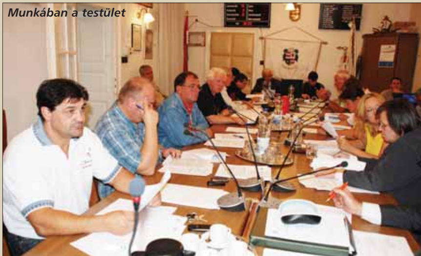
Munkában a testület