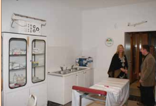
Látogatók az elkészült rendelőben

- Mennyi orvos rendel ezek után Veresegyházon?