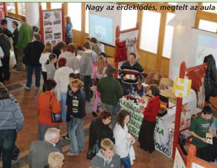
Nagy az érdeklődés, megtelt az aula