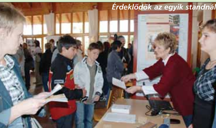
Érdeklődők az egyik standnál

A középiskolák nem jöttek hiába az tájékoztatókat élénk érdeklődés kísérte.