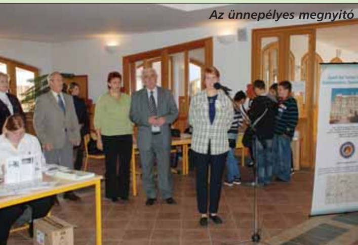
Az ünnepélyes megnyitó

Október 9-én Aszódról, Budapestről, Fótról, Gödöllőről és Vácra érkezett középiskolák mutatkoztak be a Mézesvölgyi Iskola aulájában. A pályaválasztási tanácsadással egybekötött tájékoztatók jó lehetőséget adtak azoknak a gyerekeknek és szüleiknek, akik még nem döntöttek el, hol szeretnék