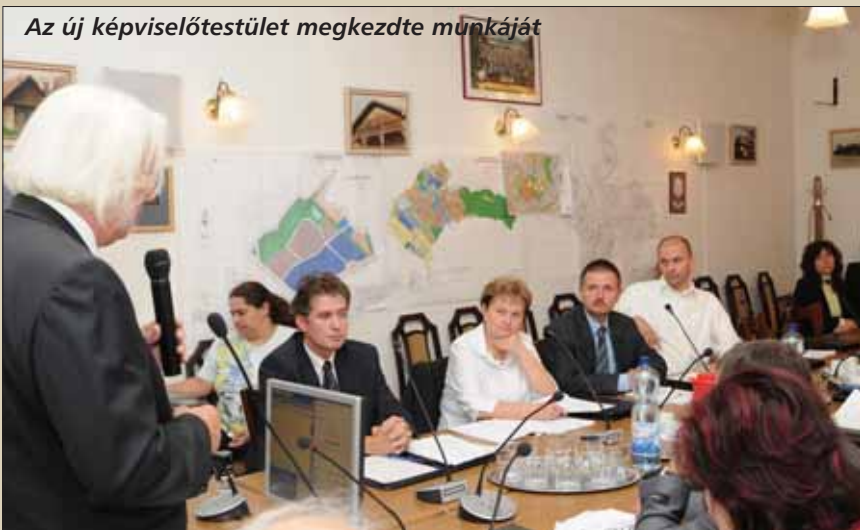
Az új képviselőtestület megkezdte munkáját

lepítést, mind az idegenforgalom fejlesztését elősegítik.