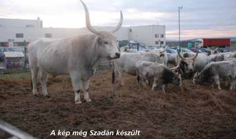
A kép még Szadán készült

Veresegyház önkormányzata vásárolta meg a szadai Nordénia gyár szürkemarhát, s a 11 tehénből, egy bikából és a borjából álló gulya mostanra már elfoglalta a helyét a Medvetthon mellett, jelentősen kibővítve a vendégcsalogató látványosságokat.