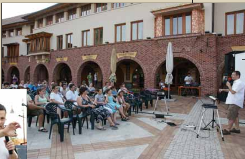
A baptista gyülekezet rendezvénye