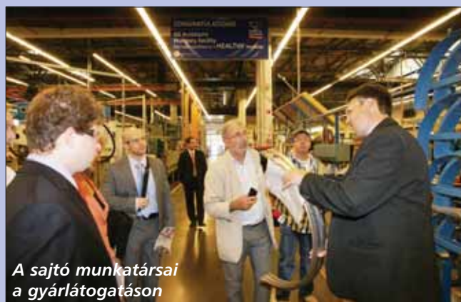
A sajtó munkatársai a gyárlátogatáson