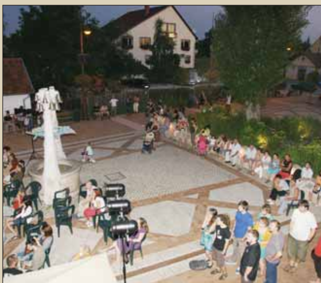
Miénk itt a fő tér