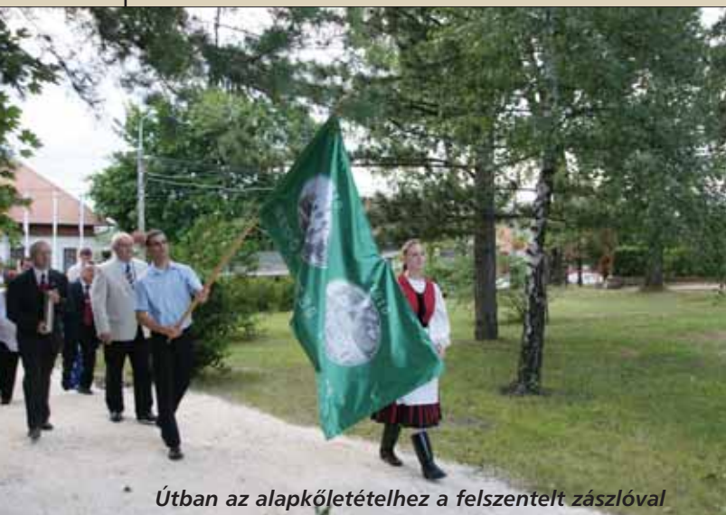
Útban az alapkövetételhez a felszentelt zászlóval