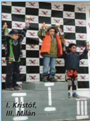
I. Kristóf, III. Milán