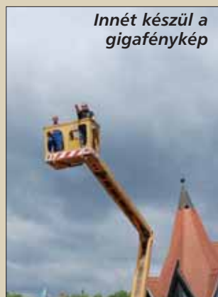
Innét készül a gigafénykép