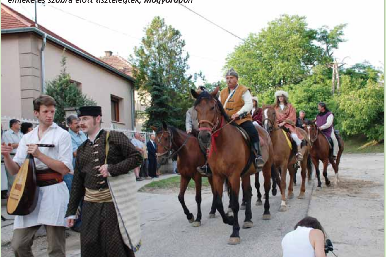
A Veresi Katonai Hagyományőrzők Szent László királyunk emléke és szobra előtt tisztelegtek, Mogyoródon