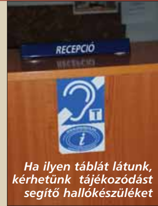
Ha ilyen táblát látunk, kérhetünk tájékozódást segítő hallókészüléket

tek az új szabványnak megfelelő mozgáskorlátozott parkolók, átalakították a bejárati ajtókat, olyan felszereltségű felvonó van az épületben, amelybe könnyű beszállni és kiszállni, s a kerekesszékes emberek is elérik a gombokat. A gyengénlátókra is gondoltak, kitapintható jelzésű a lift kezelőpultja.