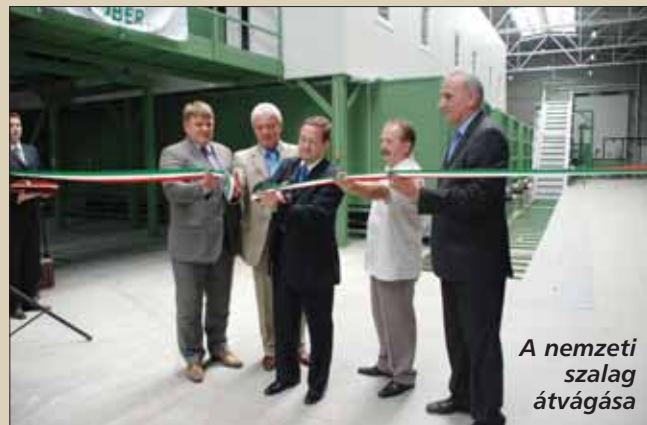
A nemzeti szalag átvágása

vetően a Tavorózsa Rádió riportere megkérdezte a számunkra