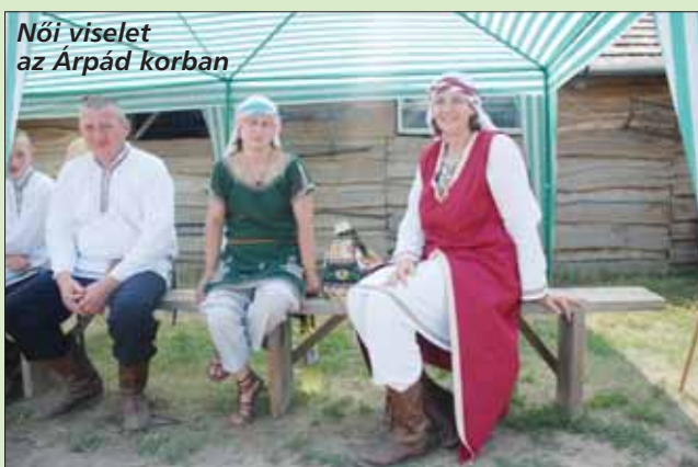
Női viselet az Árpád korban