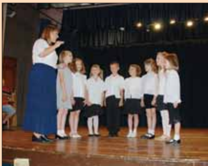
Virágos Veresegyház, Virágos Porta

Évzáró a Szó-Fogadó Kistérségi Általános Iskolában