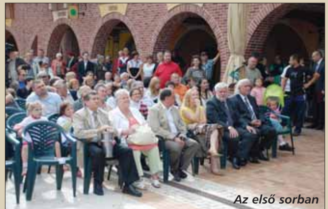
Az első sorban