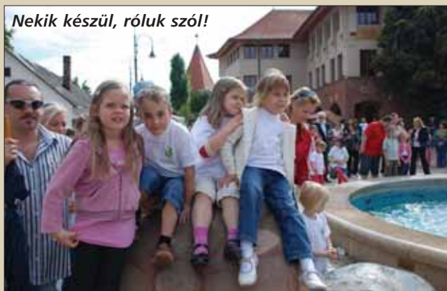
Nekik készül, róluk szól!