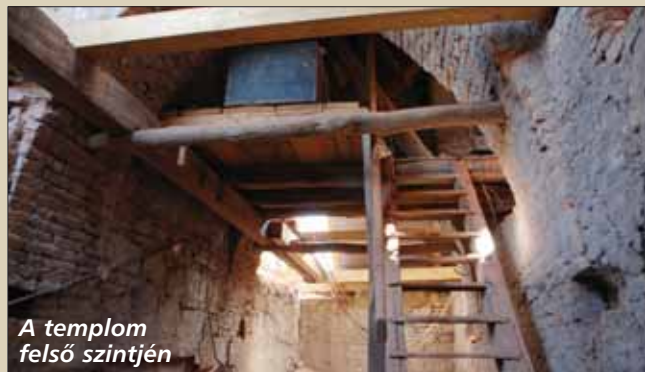
A templom felső szintjén