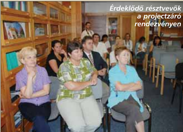
Érdeklődő résztvevők a projectzáró rendezvényen

EU-s pályázati összegből fejlesztett a Misszió. Így érték el, hogy az egyre szigorodó követelményeknek is maradéktalanul megfeleljenek. A pályázati kiírás szerint az épület teljes akadálymentesítése