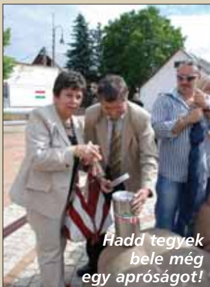
Hadd tegyek bele még egy apróságot!