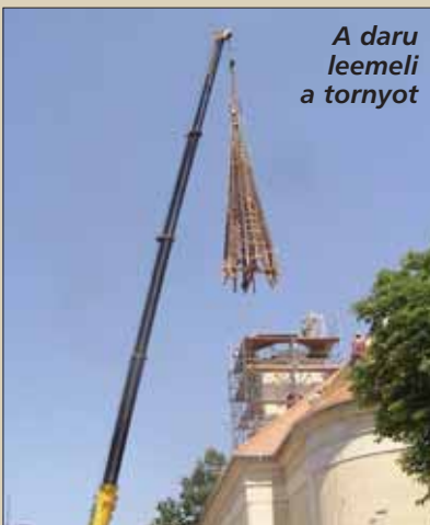
A daru leemeli a tornyot