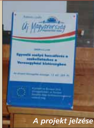
A projekt jelzése