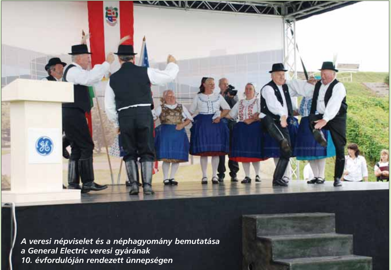
A veresi népviselet és a néphagyomány bemutatása a General Electric veresi gyárának 10. évfordulóján rendezett ünnepségen