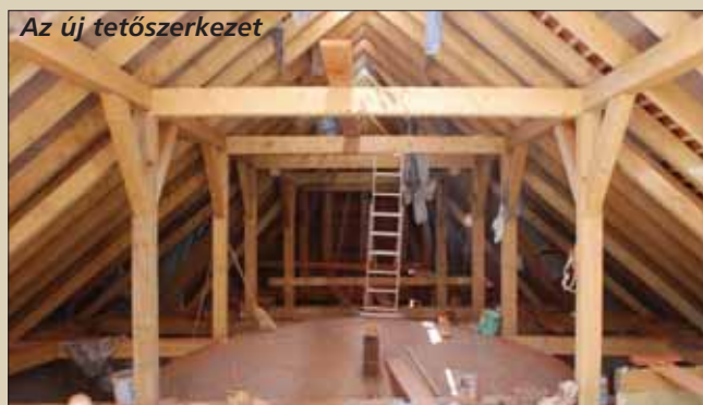
Az új tetőszerkezet