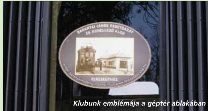
Klubunk emblémája a géptér ablakában

Tóth László (A fotókat Gombos István és a szerző készítette.)