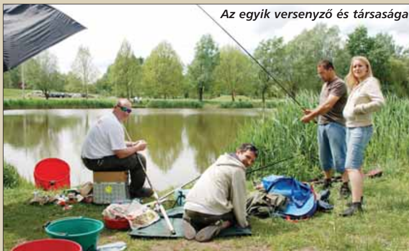
Az egyik versenyző és társasága