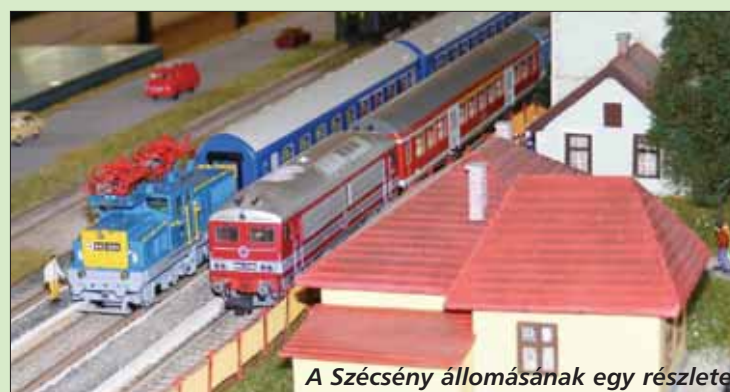
A Szécsény állomásának egy részlete