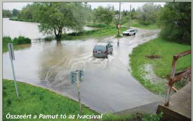
Összeért a Pamut tó az Ivacsival