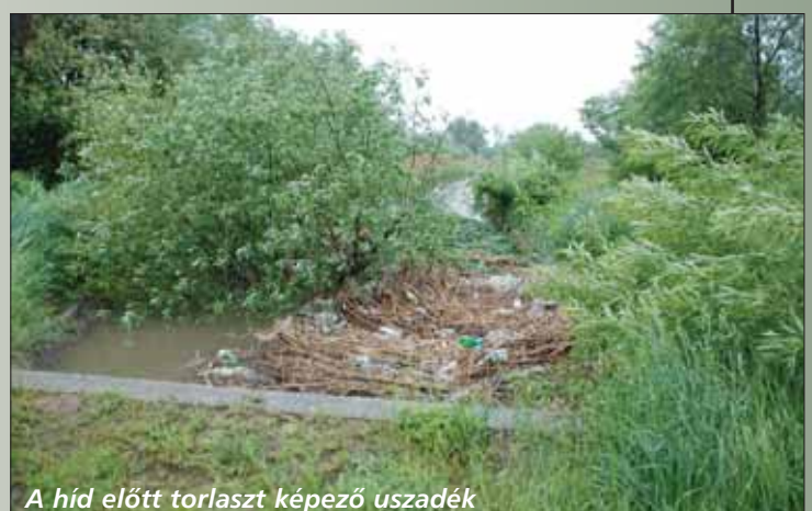
A híd előtt torlaszt képező uszadék