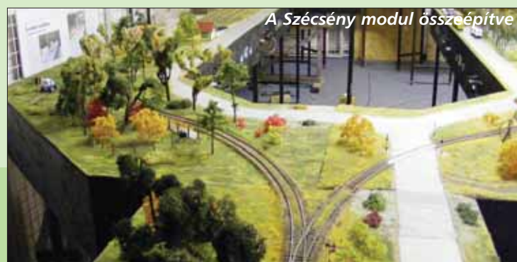
A Szécsény modul összeépítve