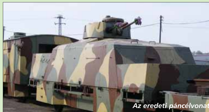
Az eredeti páncélvonat