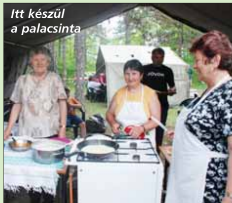
Itt készül a palacsinta