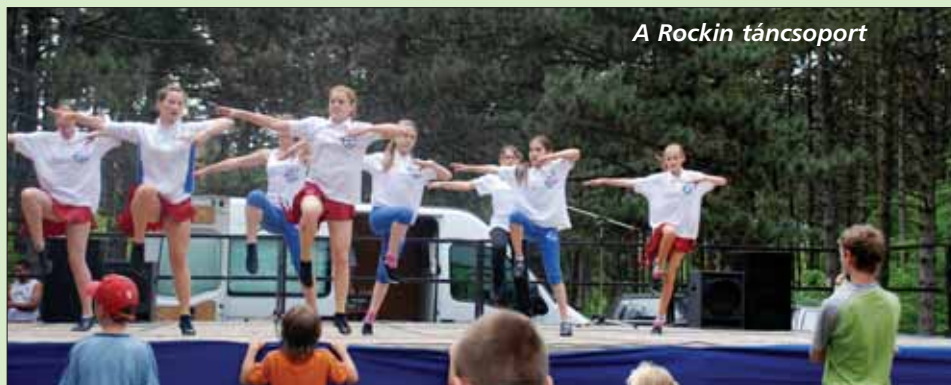
A Rockin táncsoport