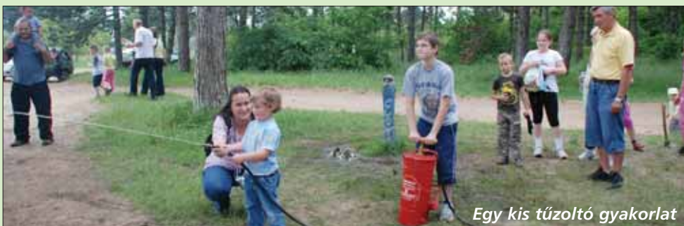
Egy kis tűzoltó gyakorlat