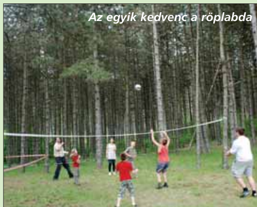
Az egyik kedvenc a röplabda