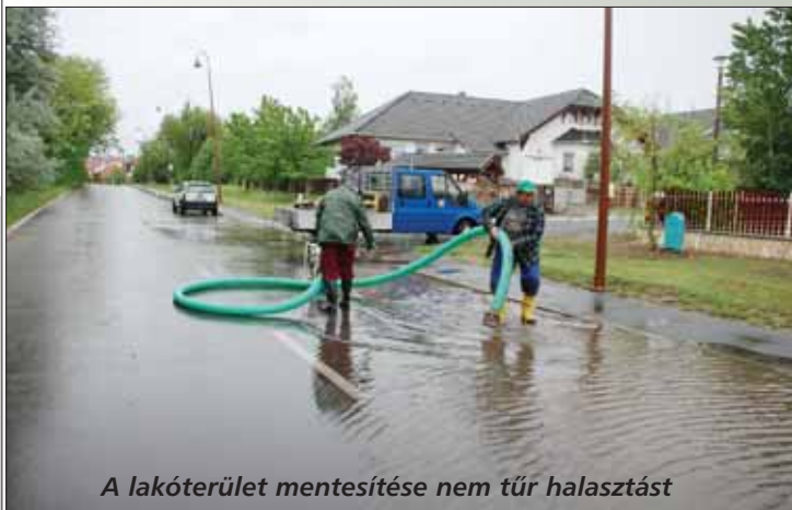
A lakóterület mentesítése nem tűr halasztást