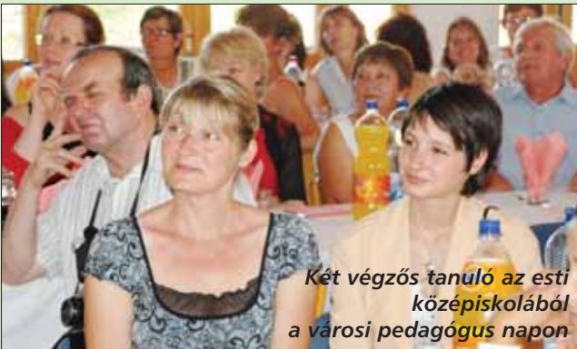
Két végzős tanuló az esti középiskolából a városi pedagógus napon

Az irodalommal kicsiny gyermekként találkoztam először. A mesék birodalmában nagyon jól éreztem magam, szívesen és sokat olvastam, néha még a kötelező házimunka helyett is a könyveket bújtam.