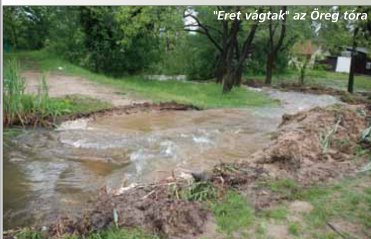
"Eret vágta" az Öreg tóra