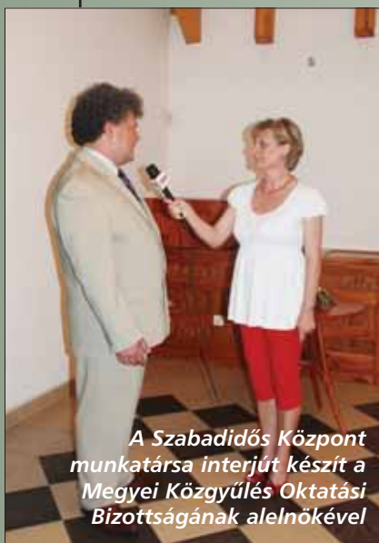
A Szabadidős Központ munkatársa interjút készít a Megyei Közgyűlés Oktatási Bizottságának alelnökével

Másfél évtizedes múlttal, de több évszázados hagyományokra támaszkodó kiállítás megnyitója volt 2010. május 29-én, Veresegyházon, a Szabadidős és Gazdasági Innovációs Centrum Konferenciatermében. A felhívást és a rendezést felvállaló Pest Megyei Közművelődési Intézet, valamint együttműködő partnerei, a veresegyházi Váci Mihály Művelődési Ház, a Népi Mesterségek Pest Megyei Egyesülete, illetve a szakértő zsűri támogatásával megvalósuló kiállításra 172 alkotó jelentkezett 1054 tárggyal.