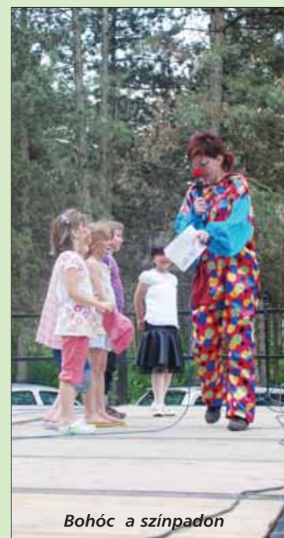
Bohóc a színpadon