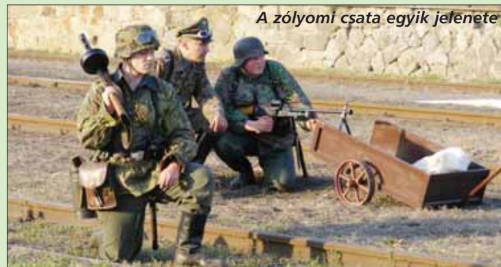
A zólyomi csata egyik jelenete