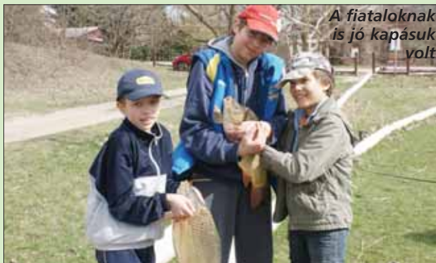
A fiataloknak is jó kapásuk volt

nak, úgy pótoljuk folyamatosan. Így mindig lesz benne kellő mennyiségű fogható hal. Akadnak 10 kg feletti pontyok is, és van a tóban süllő és csuka, meg pár méretes harcsa, továbbá kárárszok és dévérek szép számmal és jó méretben.