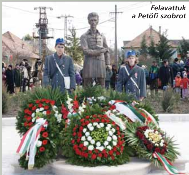
Felavattuk a Petőfi szobrot