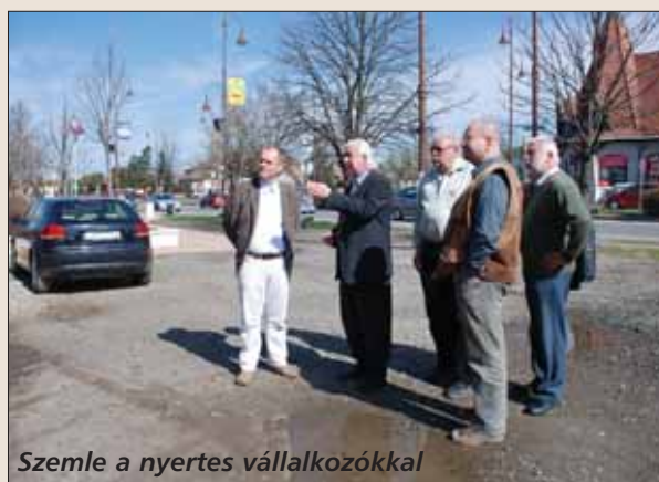
Szemle a nyertes vállalkozókkal

A sokszáz milliós munka során eltűnik több meglévő - nem éppen a város ékkövének számító - épület, hogy a helyén igényes környezet és városközpont alakulhasson ki. Így jár a 29 éve működő Maglódi Büfé is, tulajdonosa egyetértően fogadta a hírt. Polgármester úr egy helyszíni bejárásra is kivitte a nyertes cégek képviselőit.