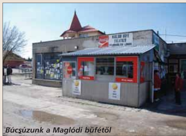
Búcsúzunk a Maglódi büfétől