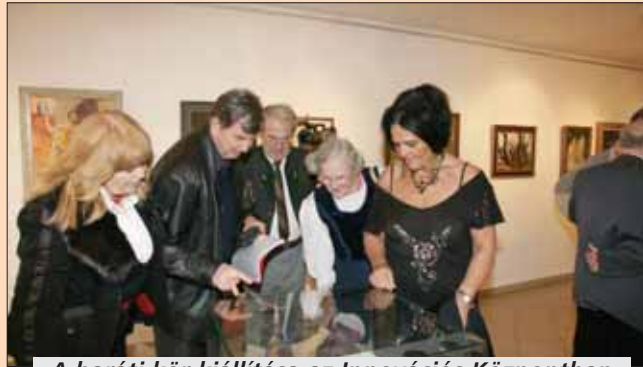
A baráti kör kiállítása az Innovációs Központban