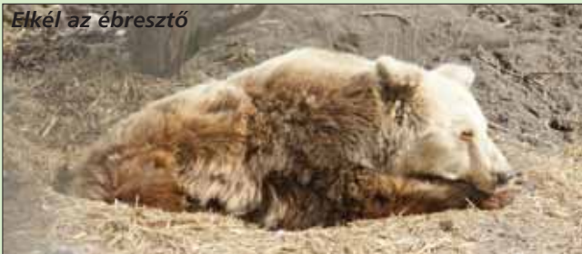
Elkél az ébresztő

Március 14-én igen szép számú közönség „ébresztgette” a medvéket. A sokadalom persze mással is szórakozhatott, hiszen láthattuk a szelíd farkasokat, kutyauskolai be-