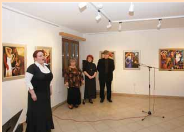
Harangozó Ilona művésznő