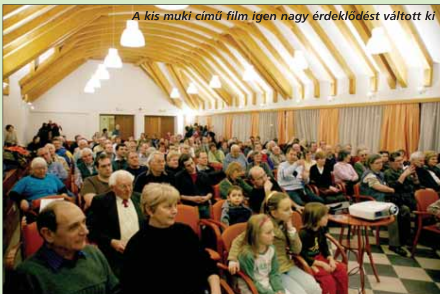
A kis muki című film igen nagy érdeklődést váltott ki