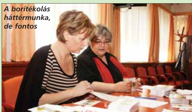
A borítékolás háttérunka, de fontos