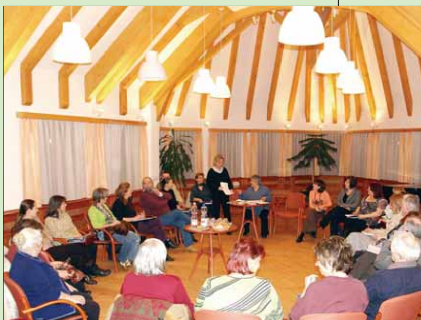
Egyeztetés a város civil szervezetei és intézményei vezetőivel a rendezvények összehangolása érdekében