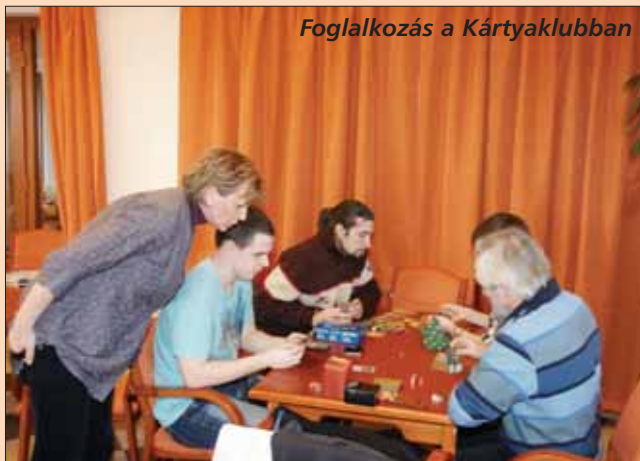
Foglalkozás a Kártyaklubban

Az 1849-49-es szabadságharc Dicsőséges Tavaszi Hadjáratának emlékére minden évben megrendezik a katonai hagyományörzők Közép-Európa legnagyobb haditornáját, eredeti egyenruhákban és fegyverzettel. Veresegyházra április 7-én délután érik el a huszárok Szada felől.