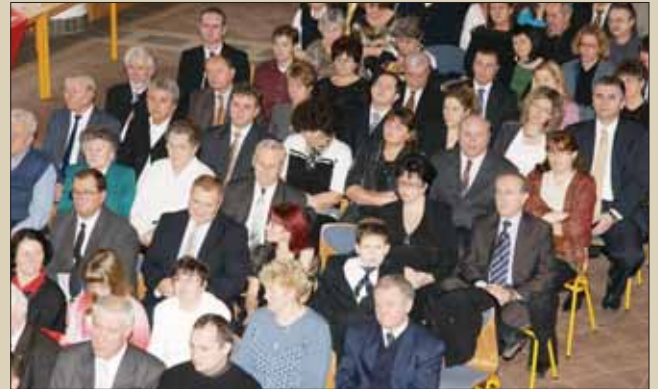
További képeinket lásd a hátsó borítón!