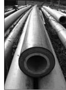
A termálvíz vezeték. A cső szigetelésére jellemző, hogy a termálvíz 1 km út megtétele során mindösszesen 1 °C hőmérsékletvesztéséget szenved el.

Mivel a város geotermikus adottságai messze meghaladják a jelenlegi kihasználtságot elképzelhető, hogy a jövőben ez a lehetőség a lakosság számára is elérhető válik, csökkentve ezáltal a lakosság anyagi terheit, úgy hogy közben a fűtésből származó környezetszennyező üvegházhatású gázok kibocsátását is visszaszorítja. Veresegyház, talán eddig nem is ébredt rá, hogy a gazdasági előnyök mellett komoly környezetvédelmi beruházást hajt végre azáltal, hogy a megújuló energiaforrások kihasználására törekszik.