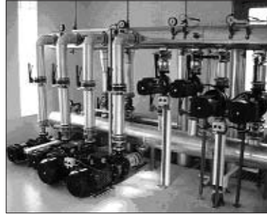
A termálvíz keringetését végző szivattyúk

kb. 1400 m mély a Csomádi út mellett található visszasajtoló kútba, hogy a föld alatt újra felmelegedve később a városnak ismét hozzáférhetővé váljon. Ez az Önkormányzatnak éves szinten kb. 70-80 MFt megtakarítást jelent, miközben 1100 tonna/év gáztüzelésből származó üvegházhatású gázok kibocsátásától mentesíti a belvárost.