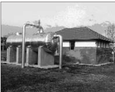
A kitermelő kúthoz tartozó és a város termálvízének folyamatos áramlását biztosító szivattyúház és levegőztető tartály. Hasontól épület és kút (ld. jobbra) található a Csomádi út mellett is, ahol a lehűlt termálvíz visszasajtolása történik

Veresegyház kb. 20 évvel ezelőtt az országban úttörőként, elhatározta, hogy a város hőenergia ellátását saját természeti adottságát kihasználva, a megújuló környezetbarát energiaforrások alkalmazásával fogja megoldani. Mára az összes önkormányzati létesítmény (a Misszió, az iskolák, a művelődési ház, néhány óvoda, a most épült bölcsőde stb...) fűtését geotermikus energiával biztosítja.