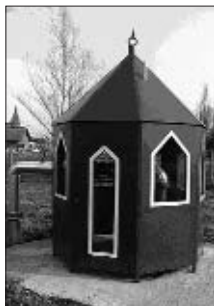
Kitermelő kút, háttérben a Mézesvölgyi Általános Iskola

Ez tulajdonképpen azt jelenti, hogy a Mézesvölgyi általános iskolával szemben található termál kútból 1462 m mélységből felszínre hozott 67 °C körüli termálvíz fűti az intézményeket, amely kb. 35-40 °C-ra lehűlve kerül vissza a