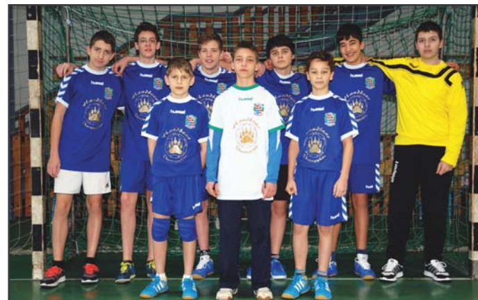
Hand Bear U14 fúcsapat