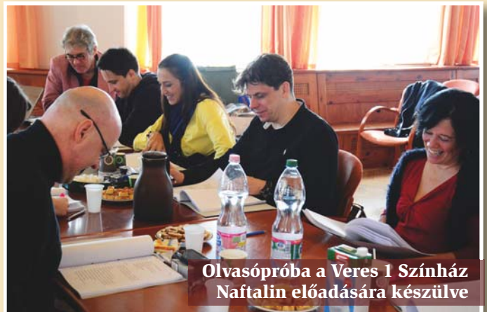
Olvasópróba a Veres 1 Színház Naftalin előadására készülve