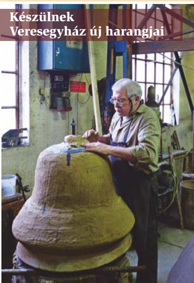
Készülnek Veresegyház új harangjai