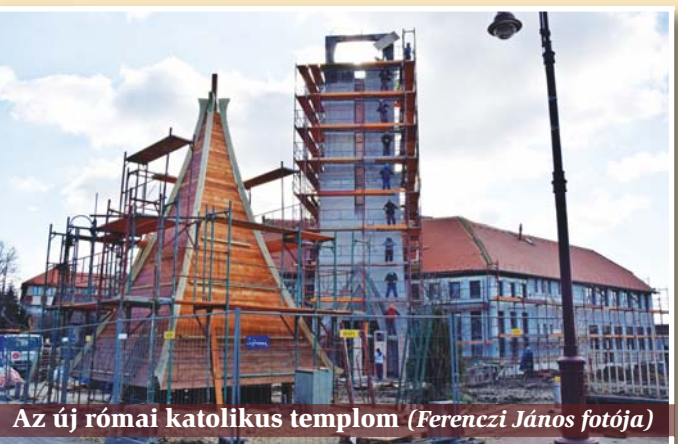
Az új római katolikus templom