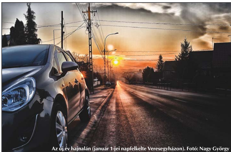
Az új év hajnalán (január 1-jei napfelkelte Veresegyházon).