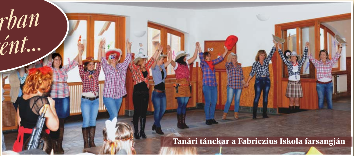
Tanári tánckar a Fabriczius Iskola farsangján