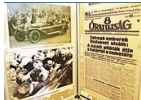
Kiállítás a Veresegyházi Paraszt Portán