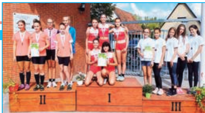
Lány III-IV. korcsoport magasugró csapat

A középiskolások csapatversenyén a Veresegyházi Katolikus Gimnázium leány versenyzői svédváltó futásban 1. és 2. helyezést értek el, a távolugró csapatuk pedig a harmadik helyen végzett!