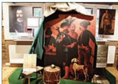
Kiállítás a Városi Múzeumban