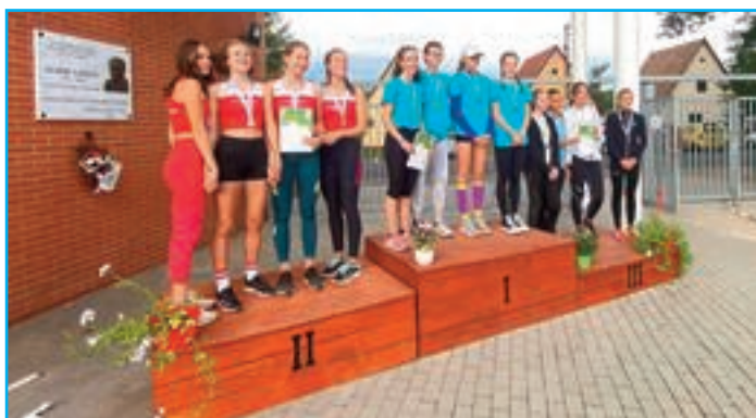
Veresegyházi Katolikus Gimnázium leány versenyzői