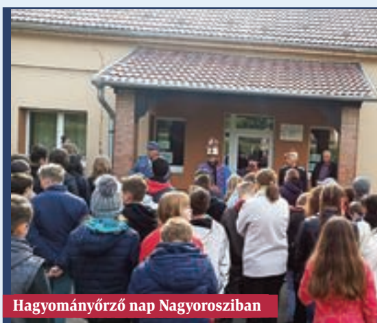
Hagyományőrző nap Nagyorosziban