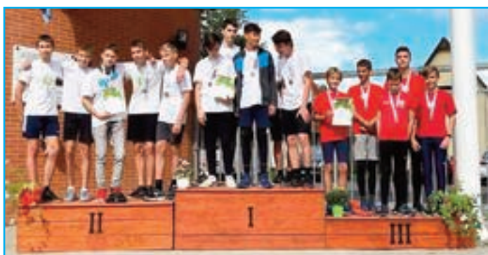
Fiúk távolugró csapata a dobogó 3. helyén