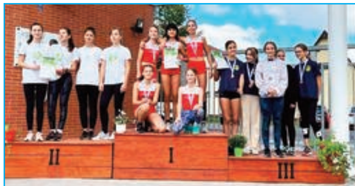
Lány III-IV. korcsoport távolugró csapat