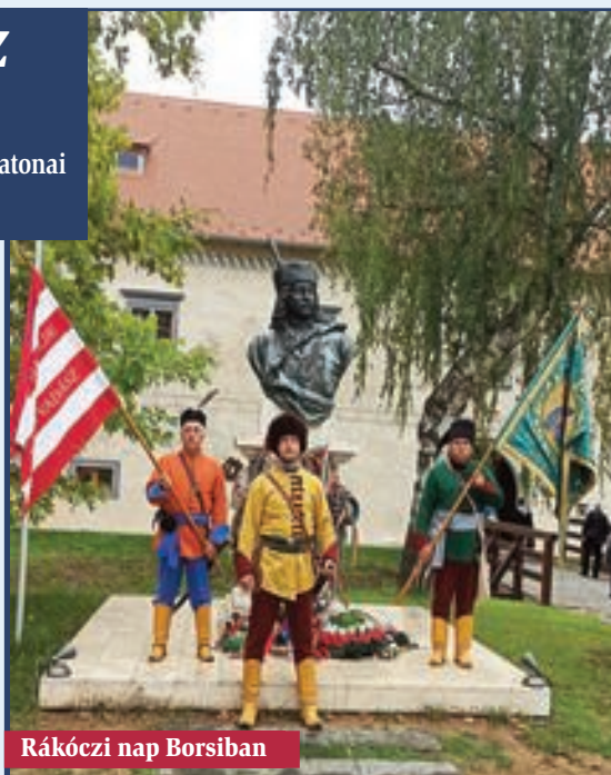
Rákóczi nap Borsiban