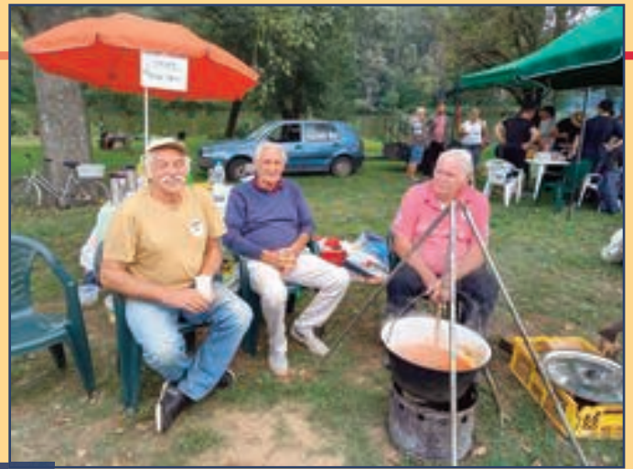
A Magyar Pamutipari Horgászegyesület és a Pamut-tó Baráti Kör ismét remek hangulatú horgászversenyt és családi napot szervezett szeptember 10-én