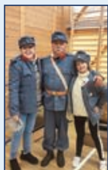
Honvédelmi nap Veresegyházon, az EGYMI-ben

Katonai hagyományőrzőink szerte az országban és határainkon túl is viszik a magyar katonai hagyományok és városunk jó hírét.