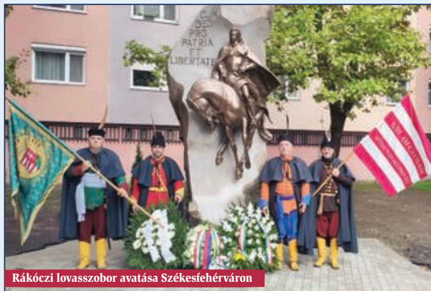
Rákóczi lovasszobor avatása Székesfehérváron