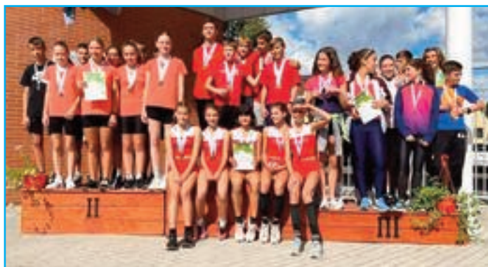
Lány III-IV. korcsoport 10x200 méteres síkfutás vegyes váltó csapata