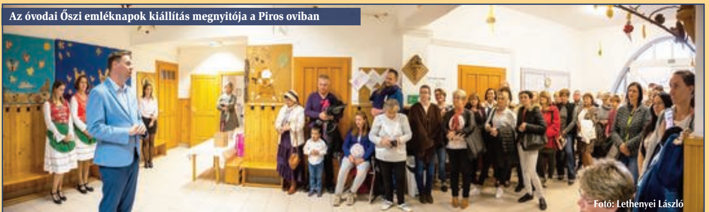
Az óvodai Őszi emléknapok kiállítás megnyitója a Piros oviban