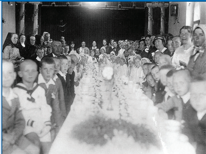
Elsőáldozók szeretetvendégsége (agapé) 1935-ben