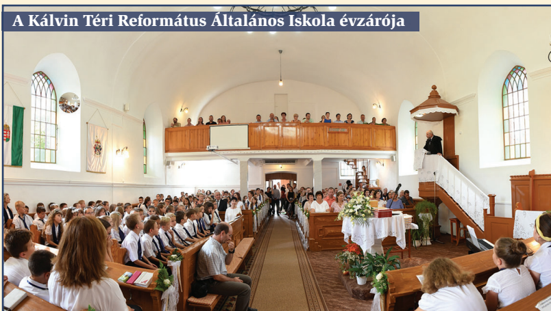
A Kálvin Téri Református Általános Iskola évzárója