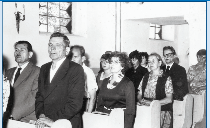
Istentisztelet az evangélikus templomban – 1980-as évek