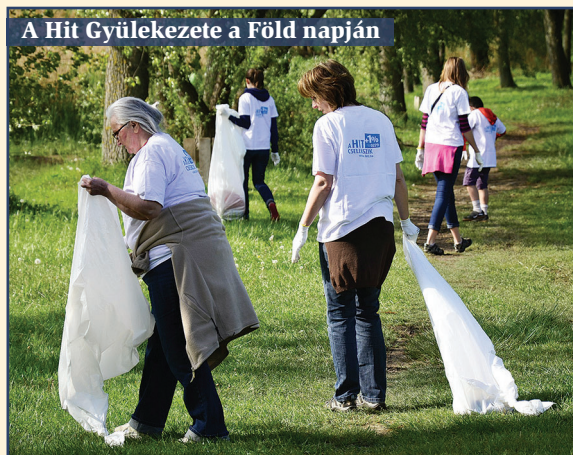
A Hit Gyülekezete a Föld napján