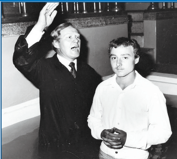
Bemerítési szertartás a baptista imaházban