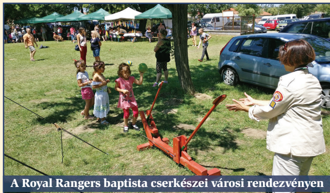
A Royal Rangers baptista cserkészei városi rendezvényen