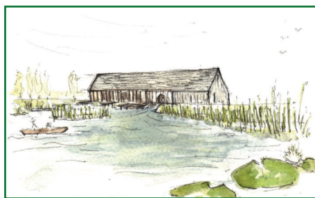
Az építész akvarellje a malomról

Egészen az 1950-es évekig működött, majd elbontották. Mára már csak a romjai őrzik emlékét. A fiatal építész így vall munkájáról: „Számomra a malom mai értelemben vett megfogalmazása termem kulcskérdése. Egykor a tó volt a maloméért, pontosabban az emberéért, annak érdekében, hogy a víz energiáját hasznosítva búzából lisztet őröljön. Ma már ezt máshogy szükségszerű megfogalmazni, hiszen a mai, technológiailag fejlett világban egyrészt funkcióját veszítette a malom, másrészt pedig története során a tó folyton csak adott, egészen