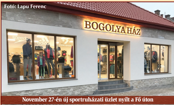
November 27-én új sportruházati üzlet nyílt a Fő úton