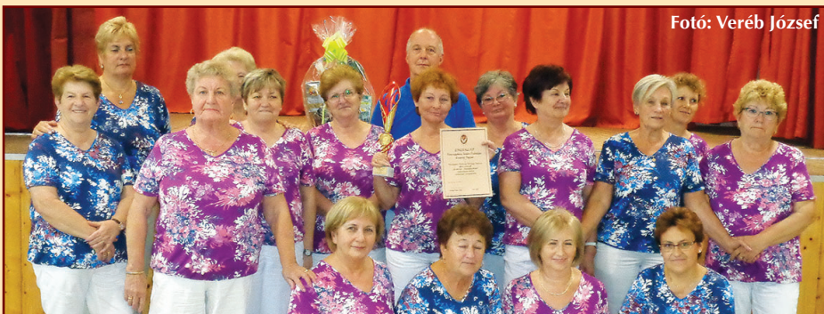
A Veregyházi Szenior Örömtánc Csoport, fennállásának 3. évfordulóján, Vácraátóton a Veregyházi Kistérség Idősügyi Tanácsa által szervezett „Ki mit tud? Nyugdíjasoknak” című rendezvényen díszserleget, oklevelet és ajándécsomagot nyert