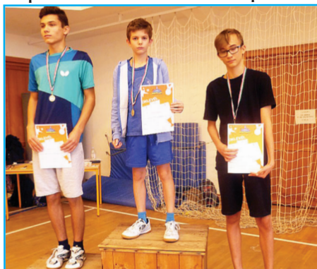
Igazolt általános iskolások