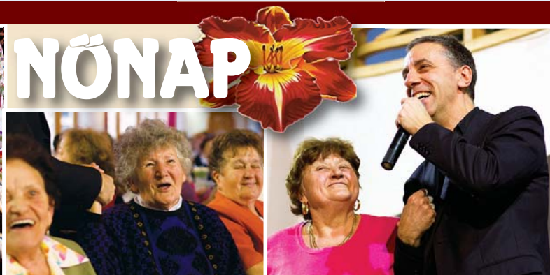
A hagyományoknak megfelelő módon köszöntötte városunk hölgyeit az önkormányzat március 12-én. A kiváló hangulatú, vendéglátással összekötött műsorban többek közt fellépett Csonka András is.