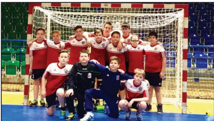
A megyei bronzérmes csapat