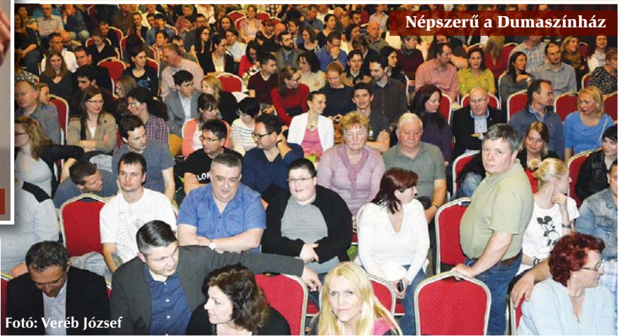
Népszerű a Dumaszínház