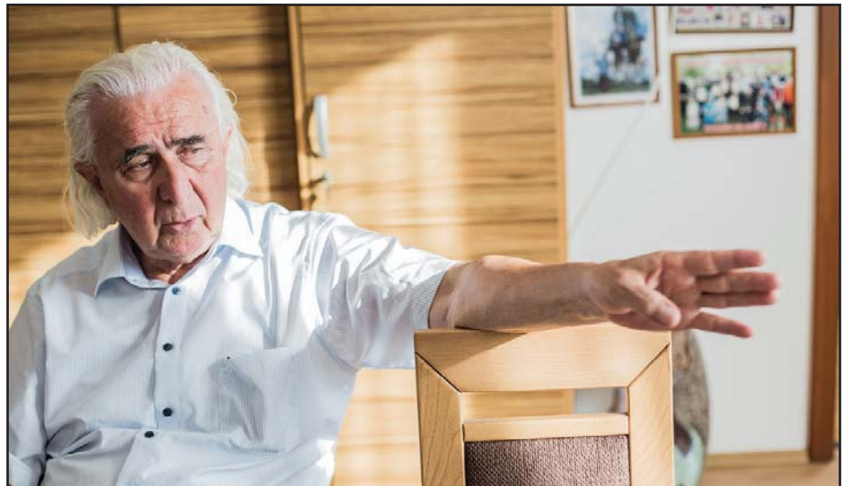
„Feladatok vannak. El kell őket végezni.”

sajtóban, televízióban is hír volt, hogy mi csoda körülmények között tengődnek ott az állatok. Isaszegről jöttem haza az akkor még kicsi unokáimmal. Megálltunk ott körülnézni. Kétszer kettes ketrechen négy-mázsás medve, fölül szögcső... A kis Bence azt mondja, ugye, papa, nem jó nekik itt? Azt mondtam, elvinnénk az állatokat. Nemzetközi segítséget is kaptunk, de Persányi Miklós is segített. Jártuk a határt, megtaláltuk a helyet, megépítettük