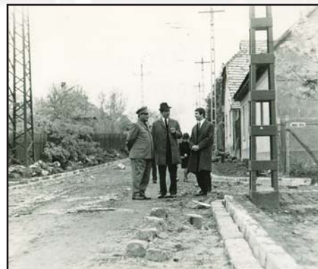
Baross utca építésénél

Ebben a formában nem, de alaptételekben igen. Tudtuk, hogy kell egy központi hely, nevezzük főtérnek, rendbe kell tenni a tava-