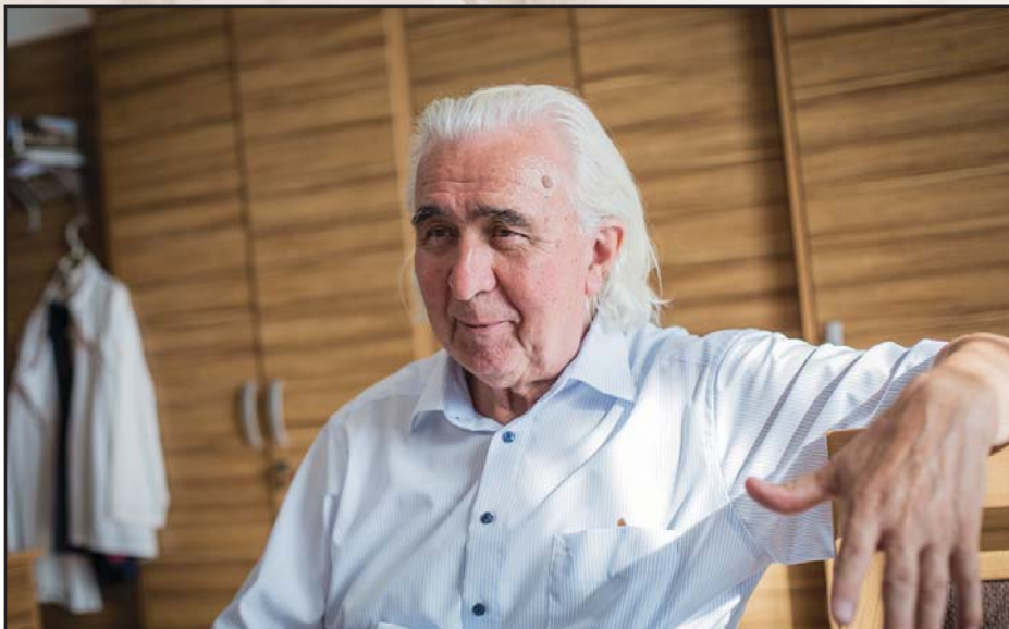
„Orsós magnón lejátszották nekem a Zizi Labor-dalt”

az új zubbonyt, minden párt az ellenjelölt mögé állt.