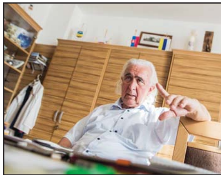
„Ne csináljunk ideológiai kérdést abból, amiből nem kell.”

Aranyos volt, gratulált. Amúgy sem tudok haragudni senkire. Amikor büntetőügy-