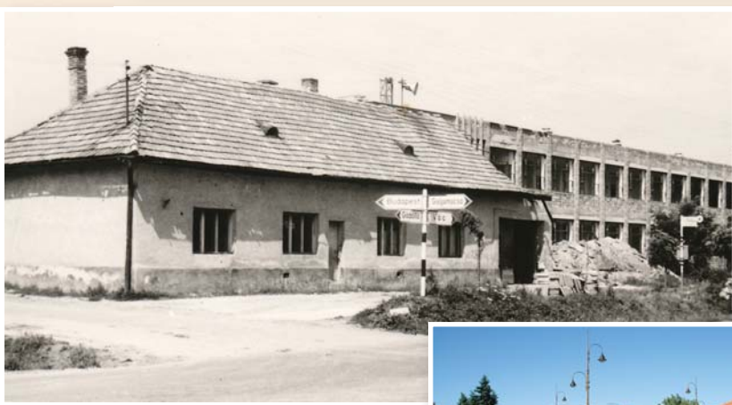
Fabriczius József Általános Iskola és útkereszteződése