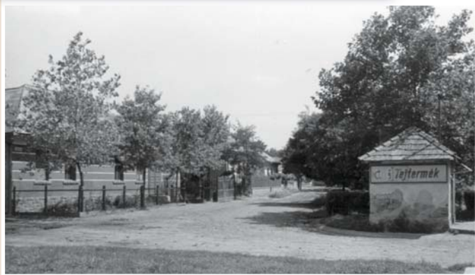
Varga Pékség és utcája